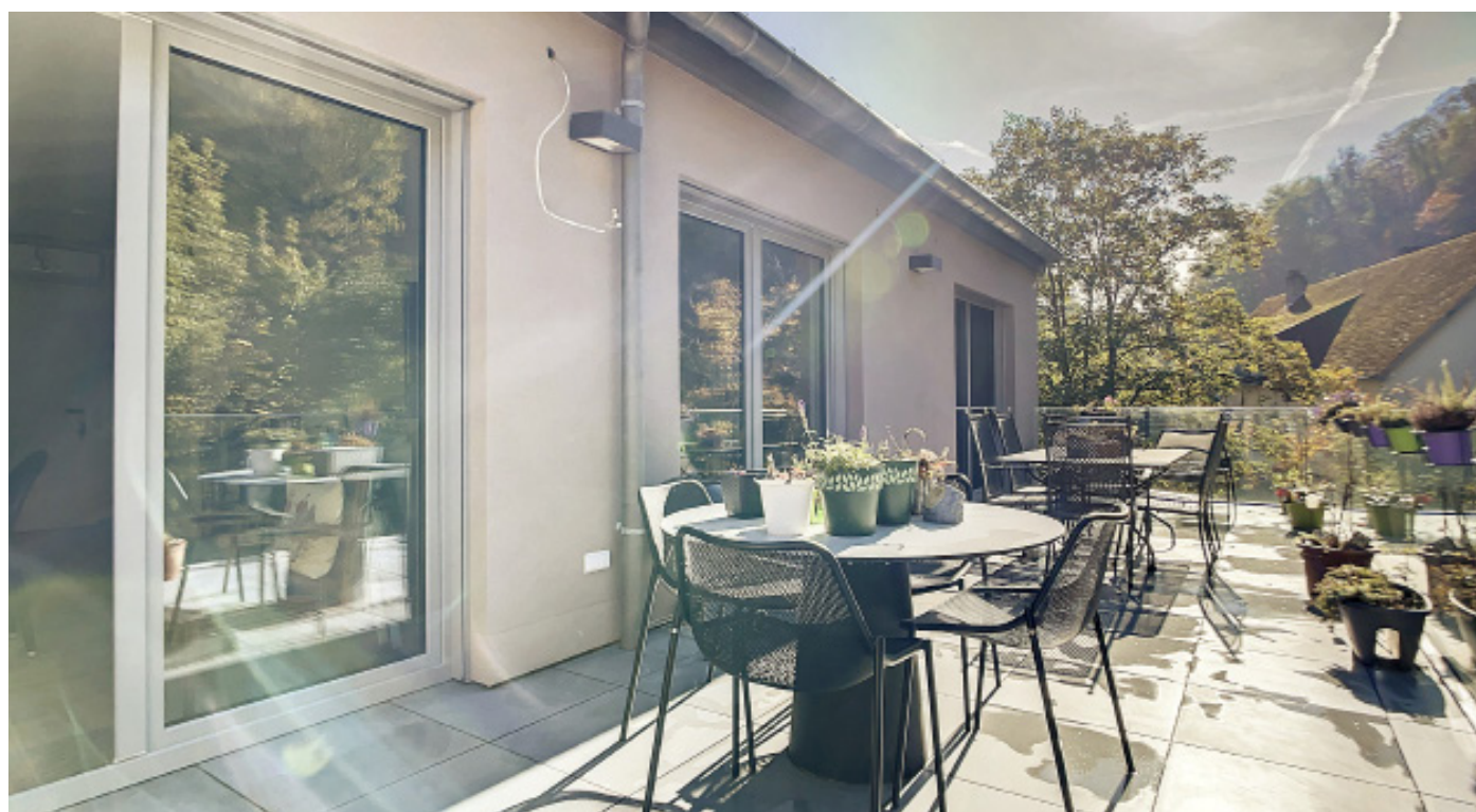
Photo extérieure - Terrasse