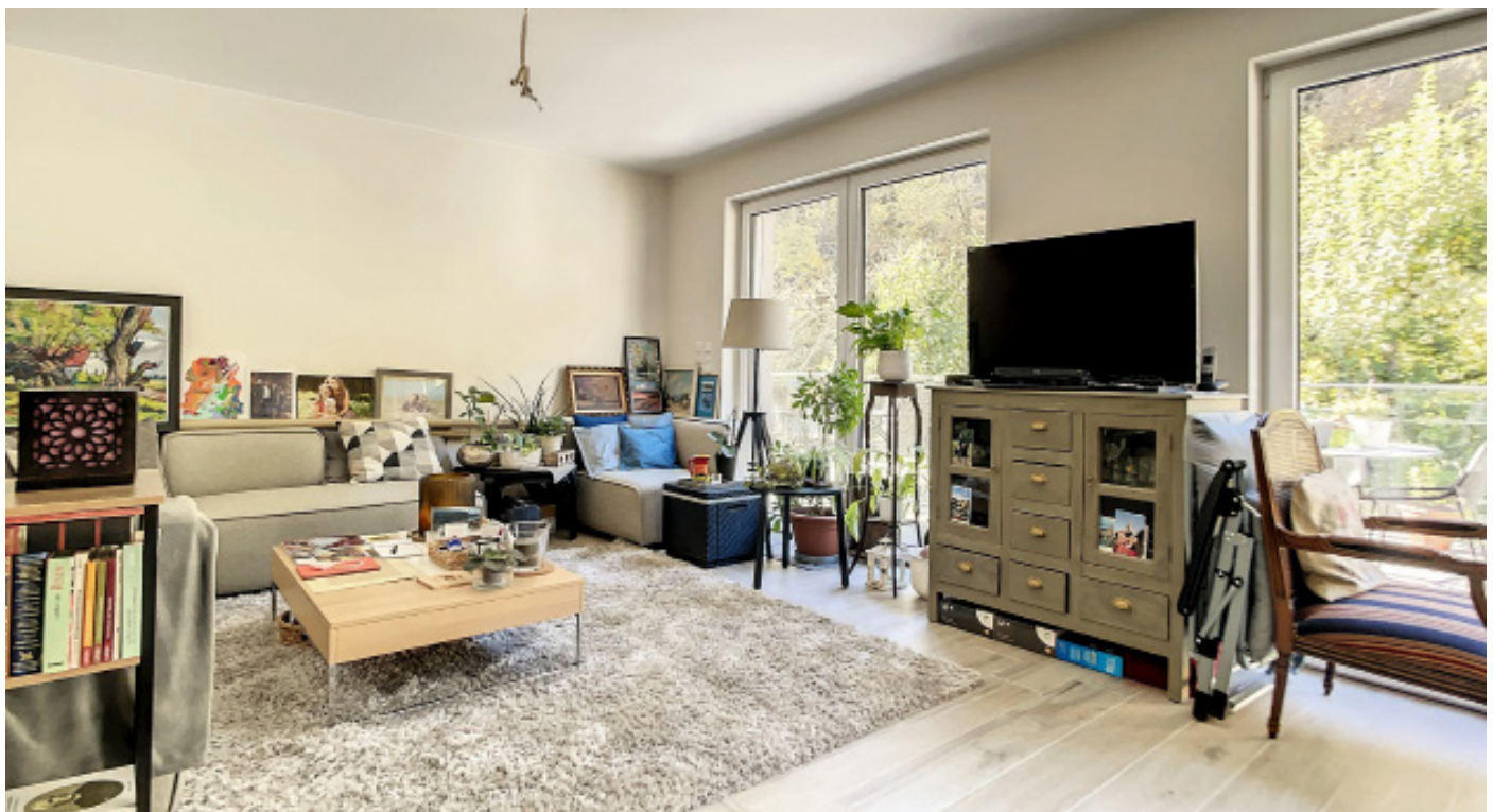
Photo intérieure - salon