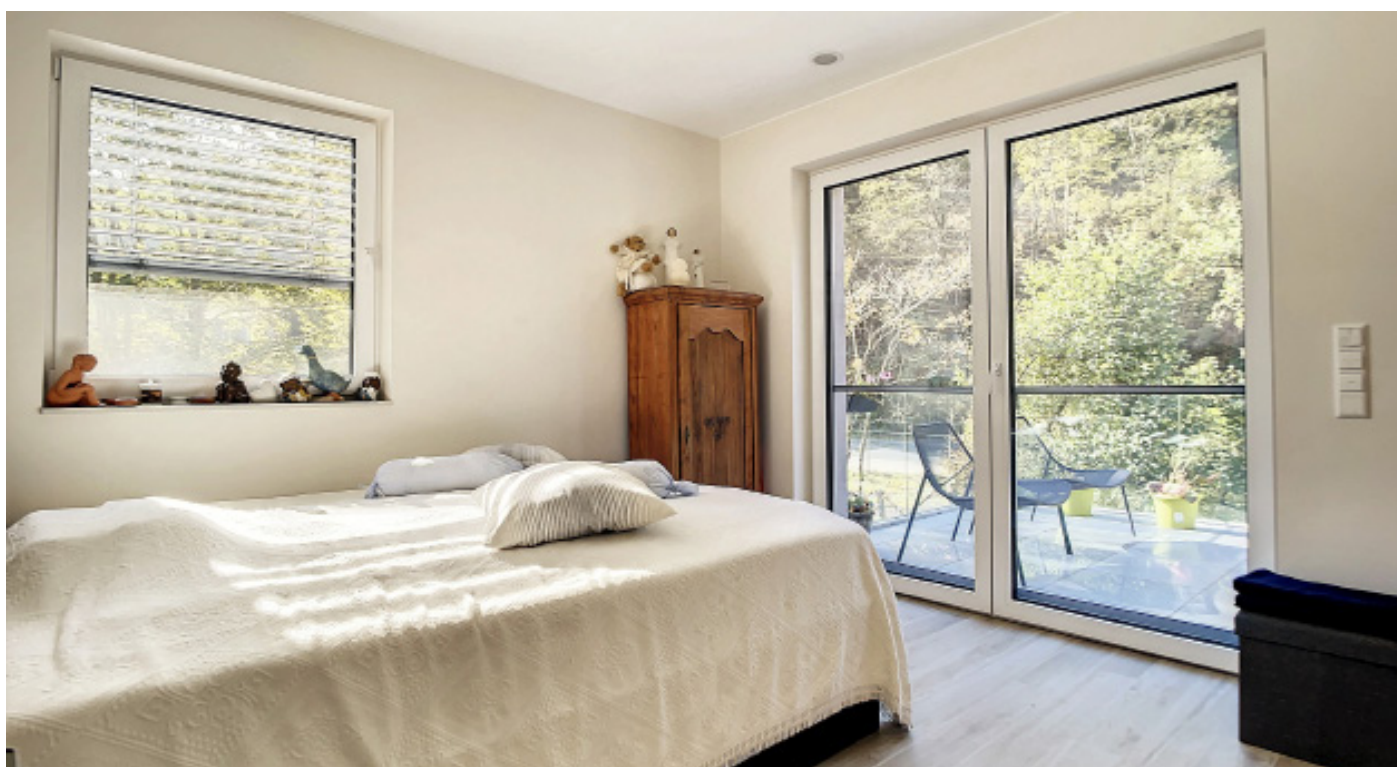
Photo intérieure - chambre