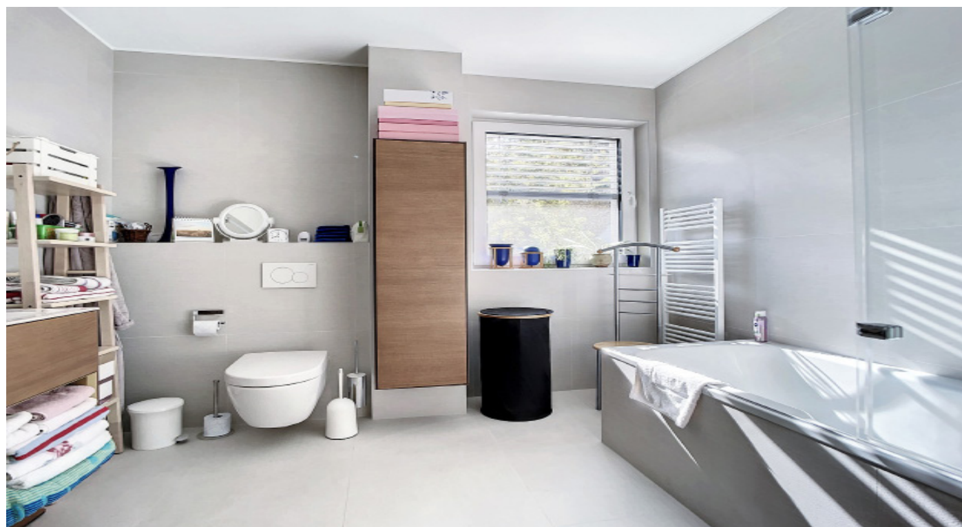
Photo intérieure - salle de bains