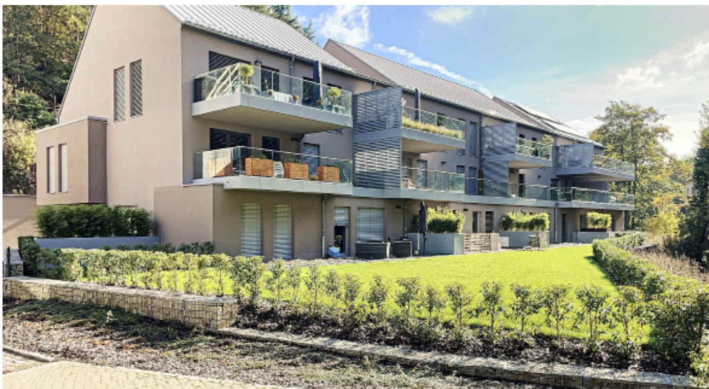
Photo extérieure -Vue extérieure