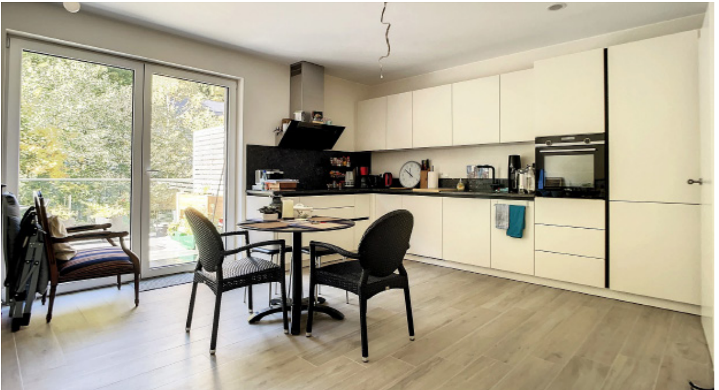
Photo intérieure - cuisine