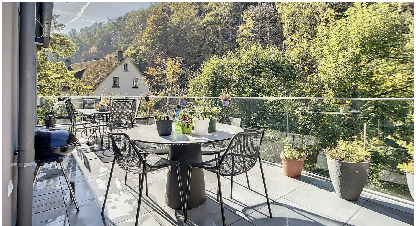
Außenfoto – Terrasse