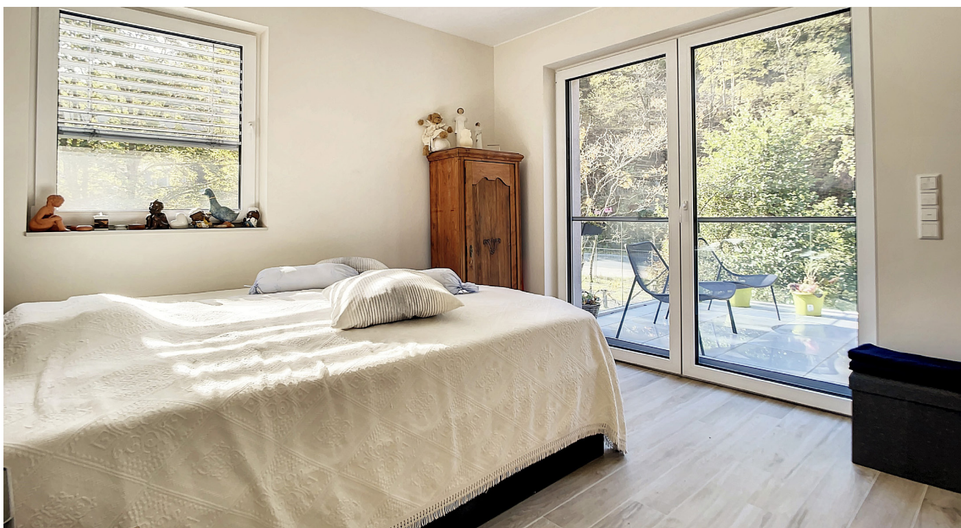
Innenfotos – Schlafzimmer