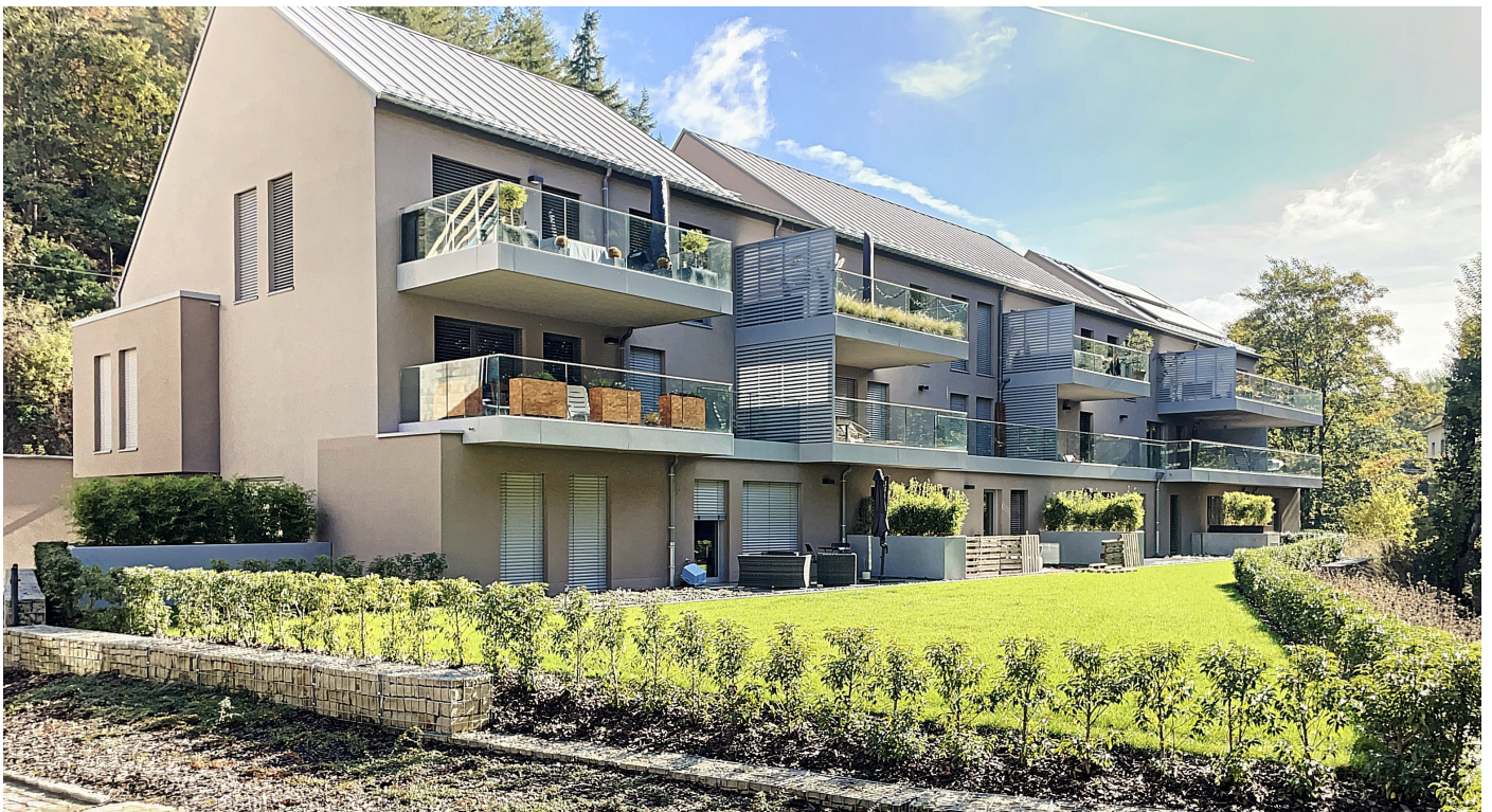
Außenfoto – Vorderansicht