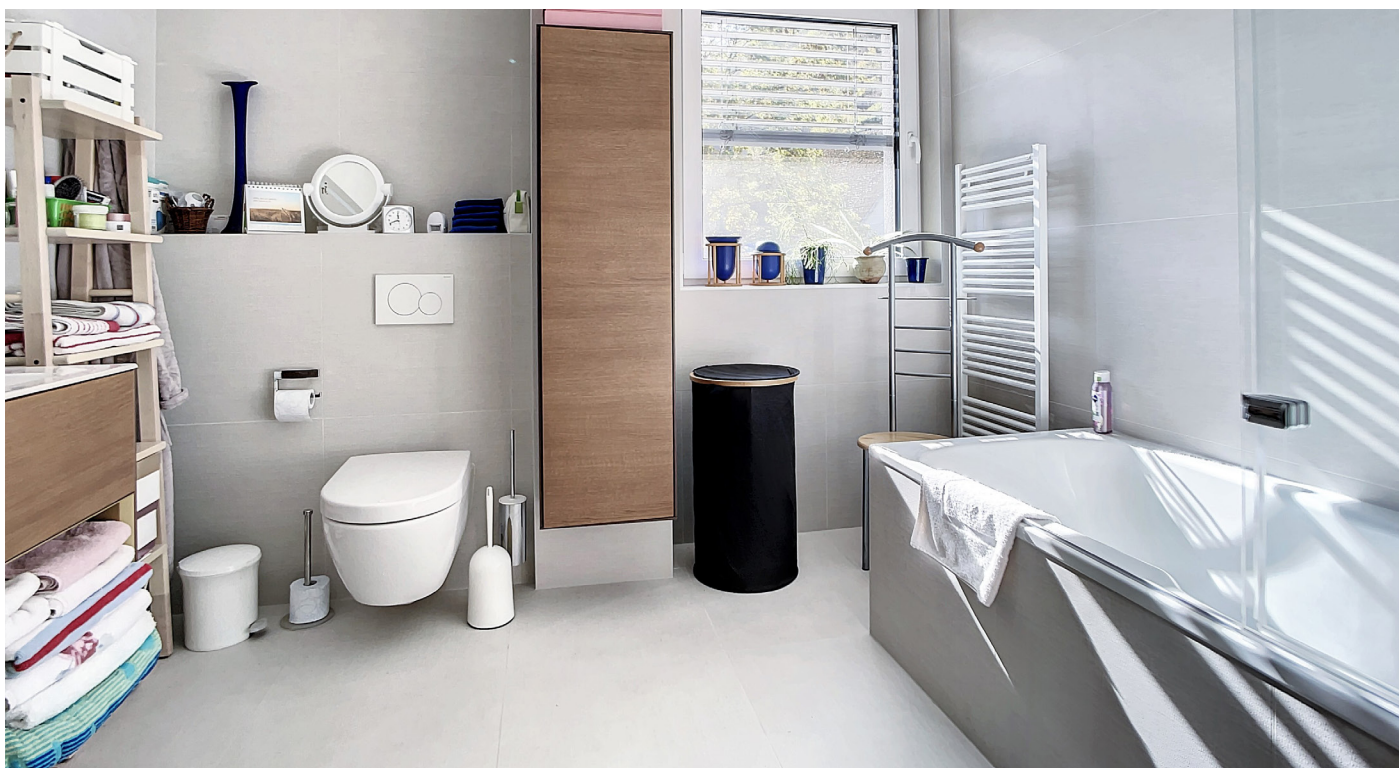
Innenfotos – Badezimmer