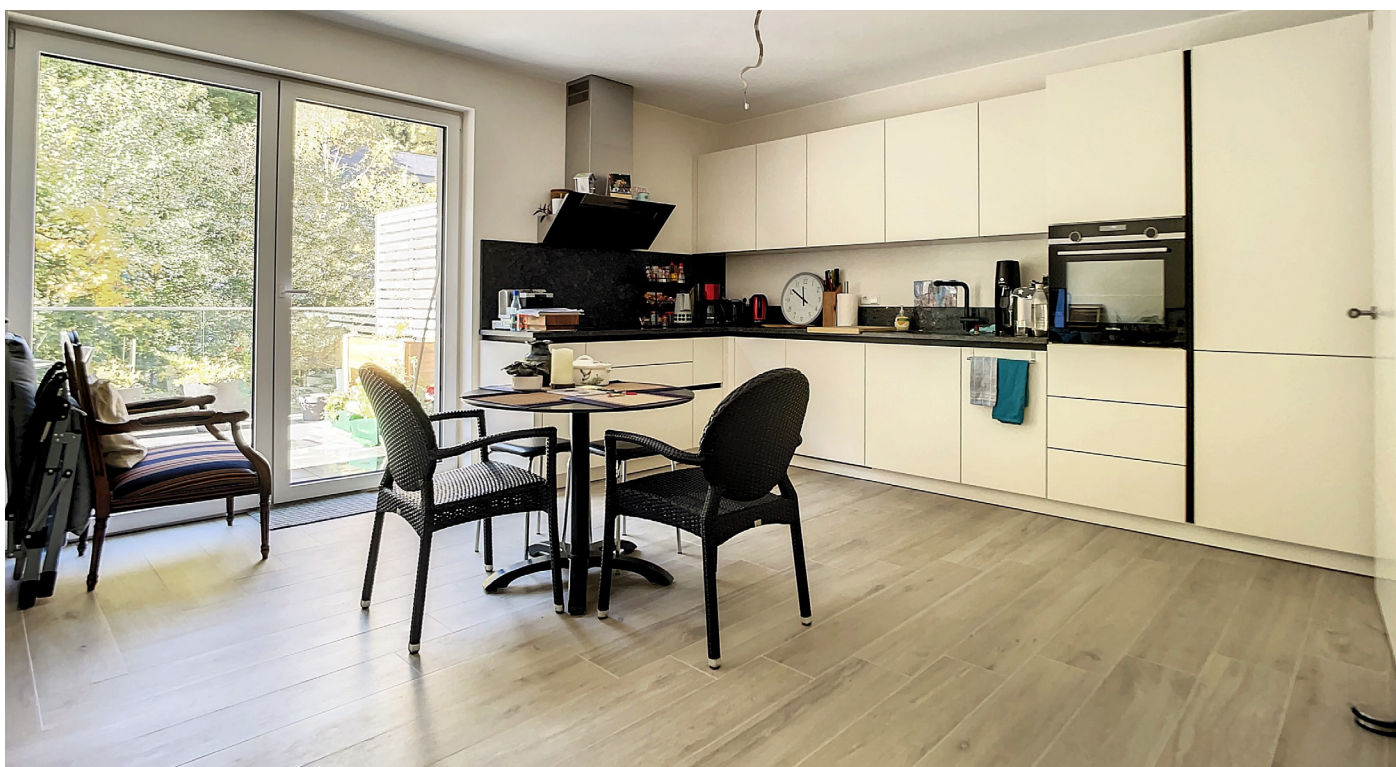
Innenfotos – Küche