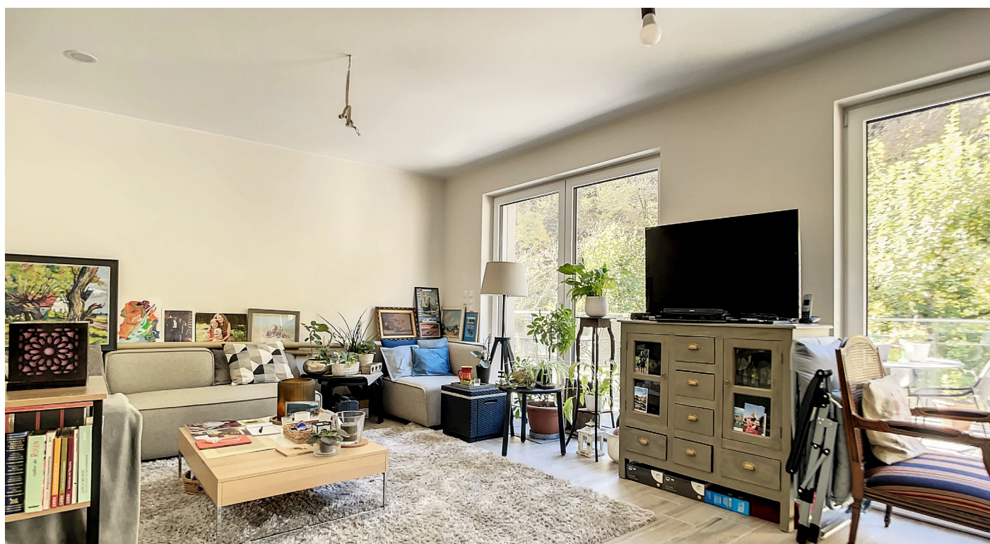
Innenfotos – Wohnzimmer