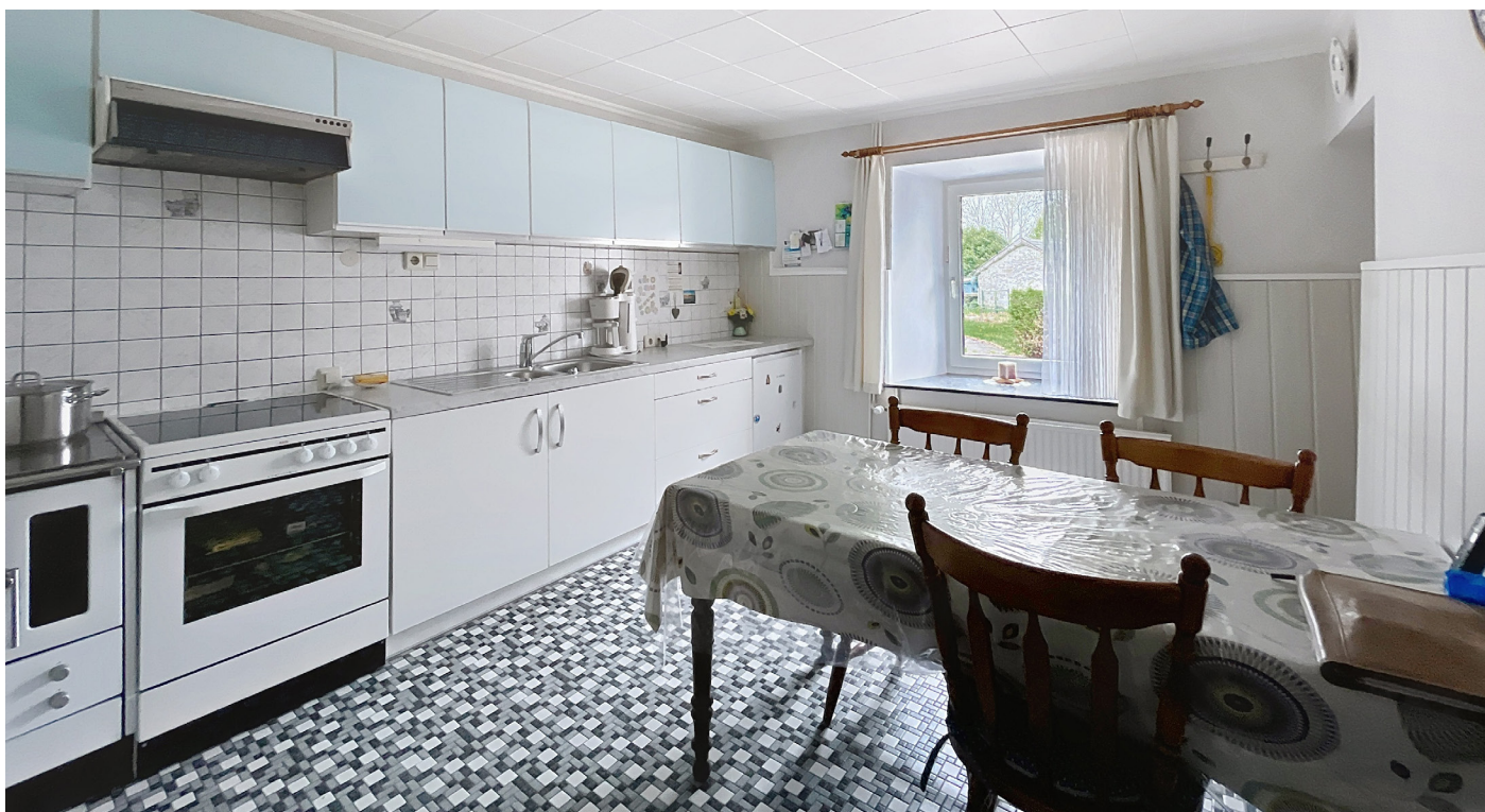
Photo intérieure - cuisine