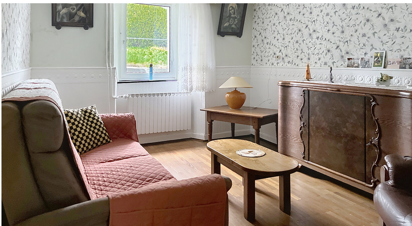
Photo intérieure - salon