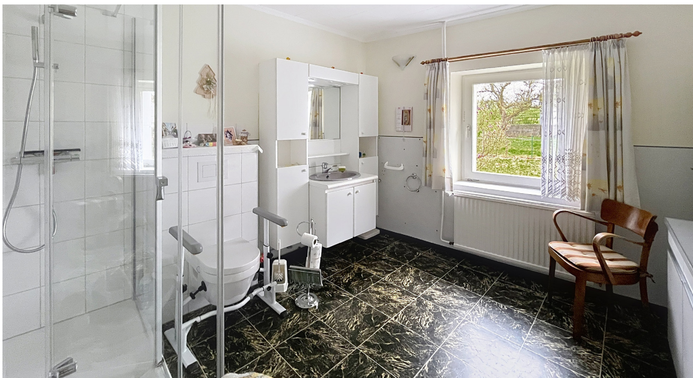
Photo intérieure - salle de douche