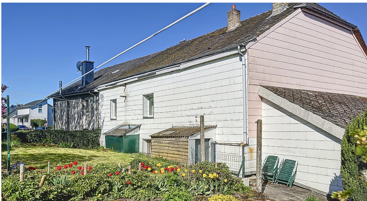
Photo extérieure - jardin