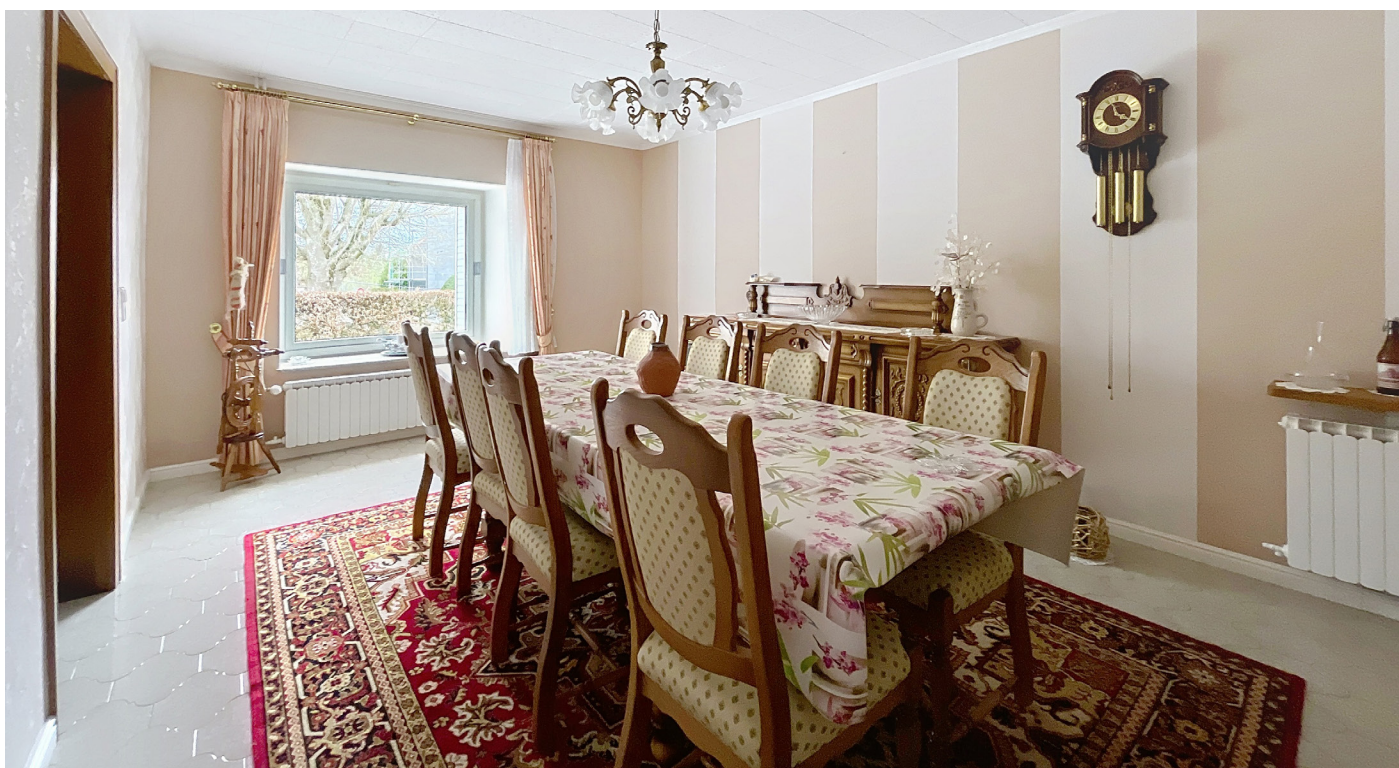
Photo intérieure - salle à manger