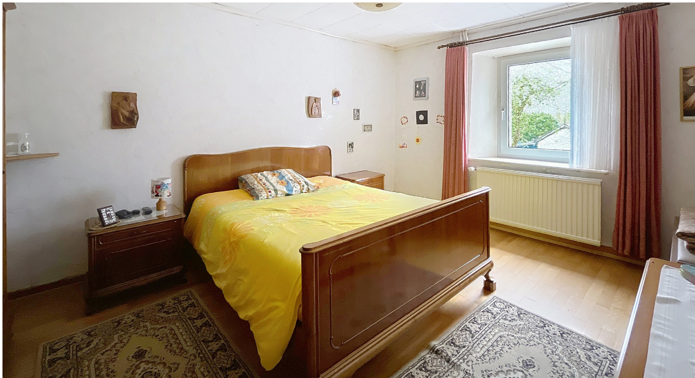
Photo intérieure - chambre 1