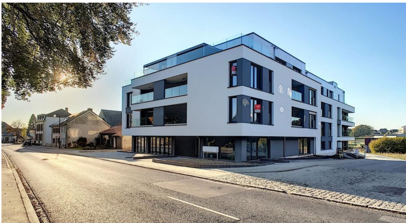
Photo extérieure -Vue extérieure