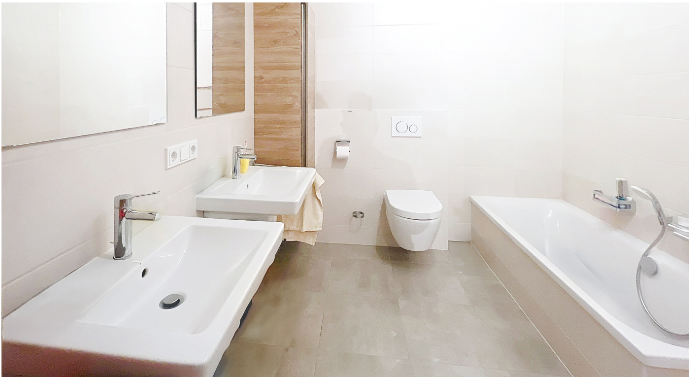
Photo intérieure - salle de bain