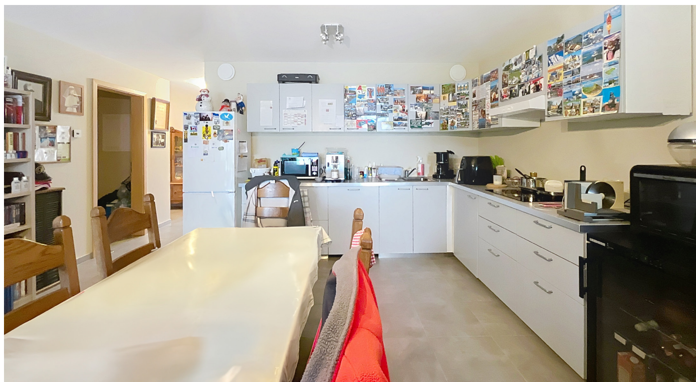
Photo intérieur - cuisine