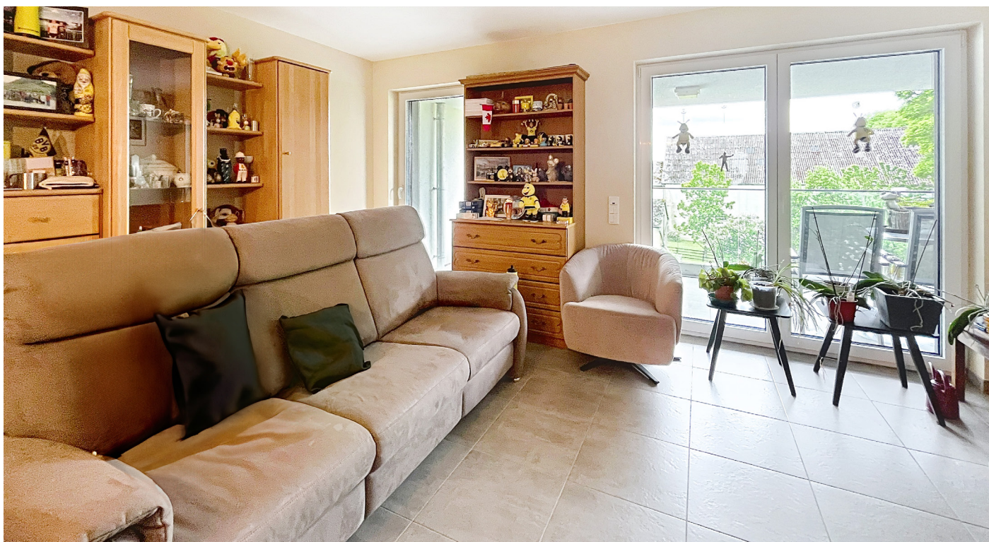
Photo intérieure - pièce à vivre