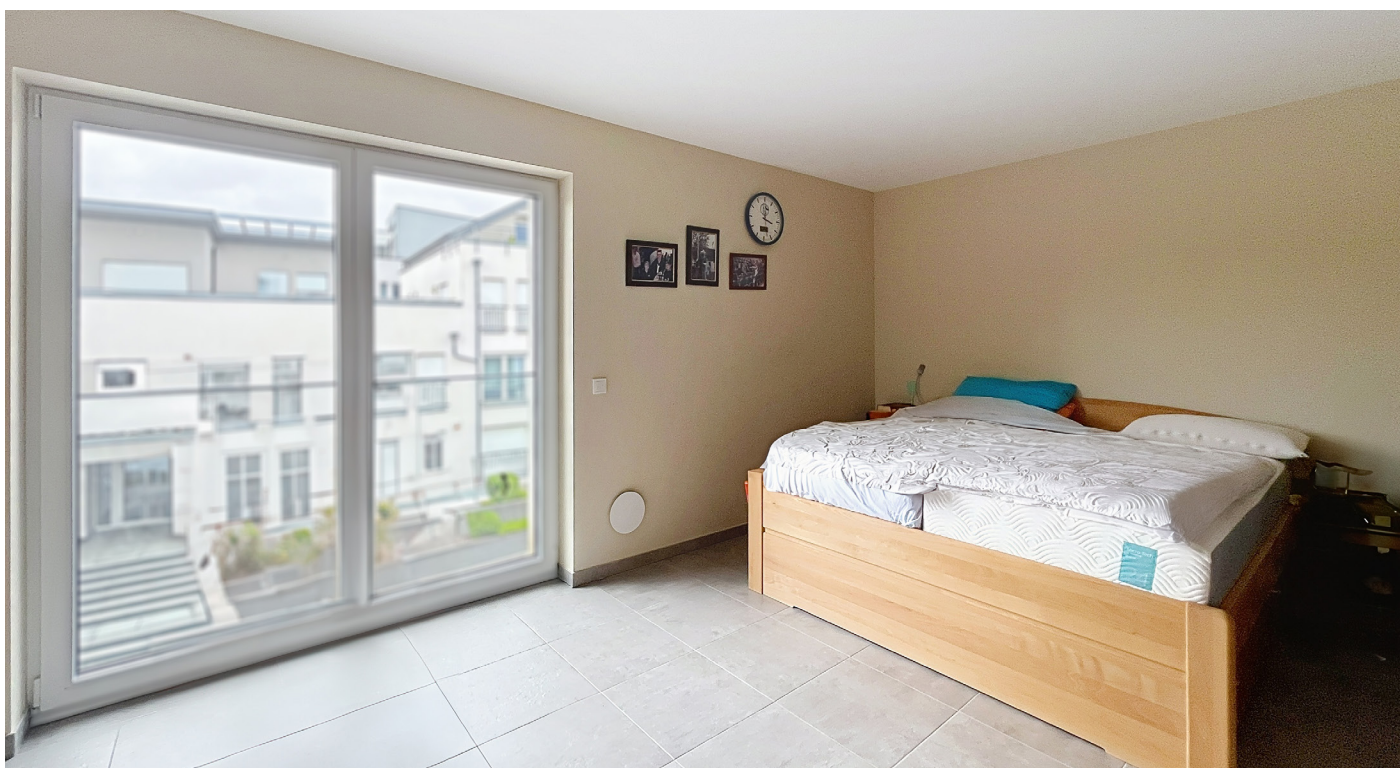
Photo intérieure - chambre