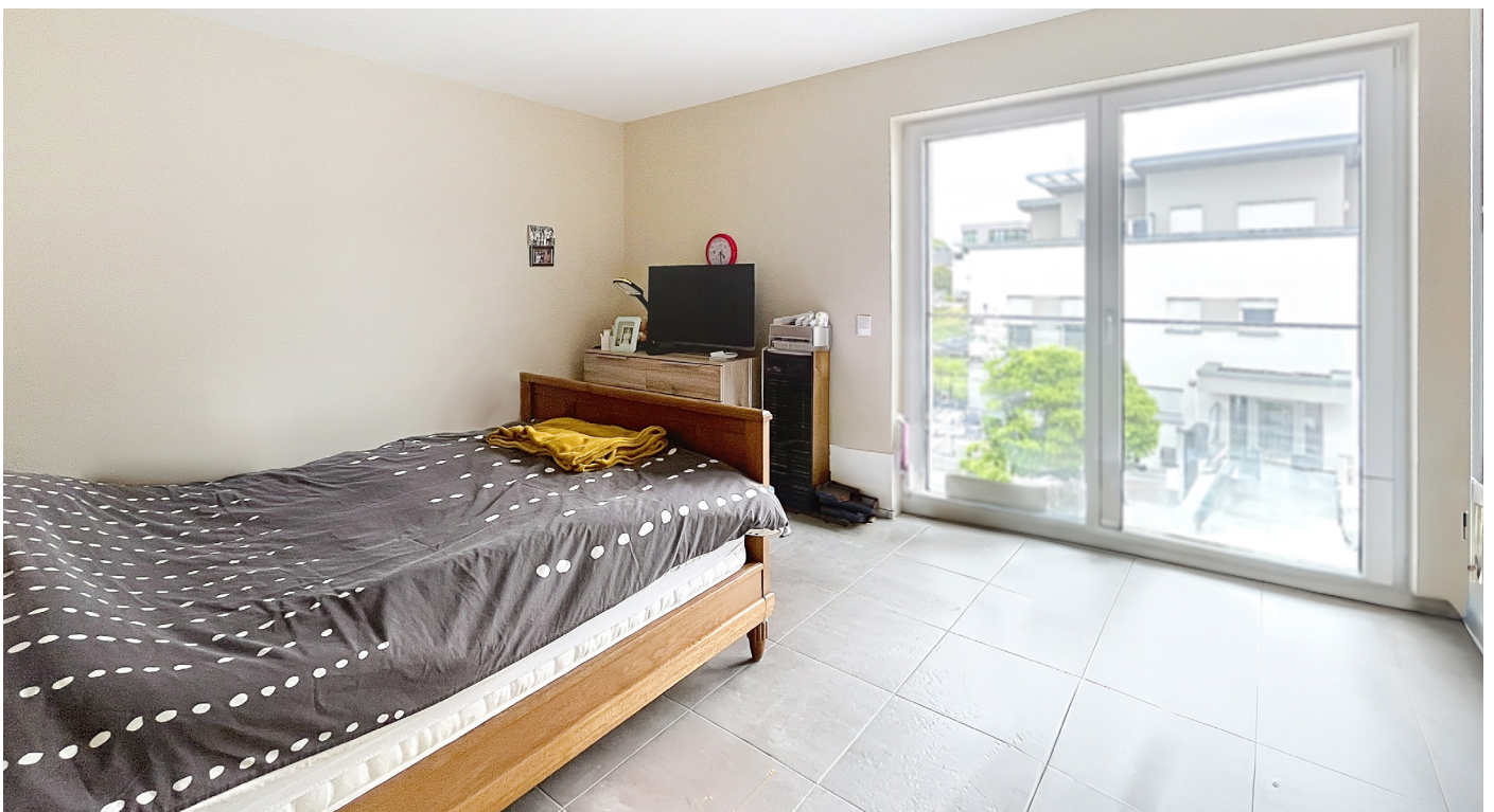
Photo intérieure - chambre