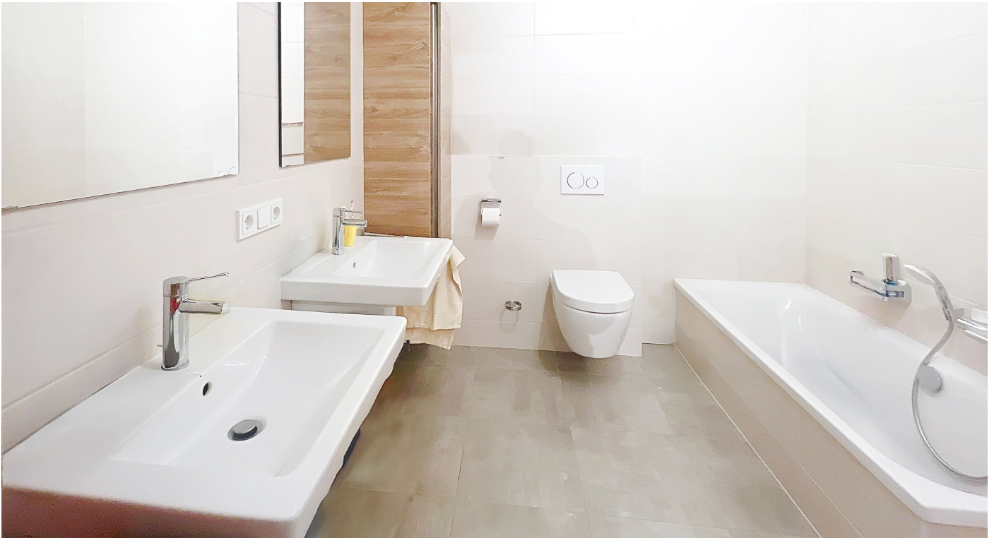
Innenfotos - Badezimmer