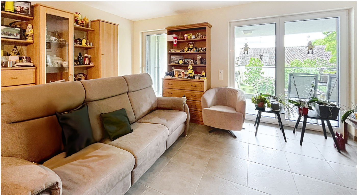
Innenfotos - Wohnbereich