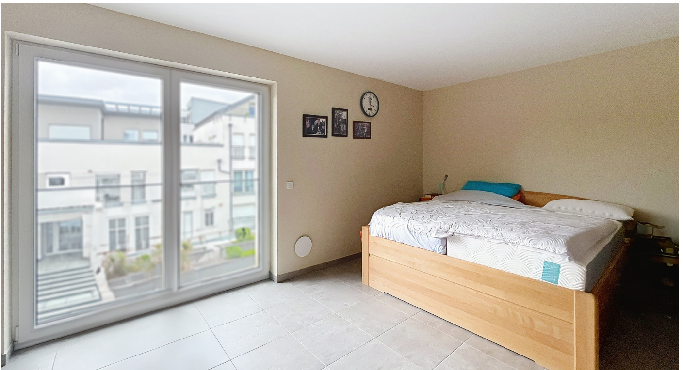
Innenfotos - Schlafzimmer