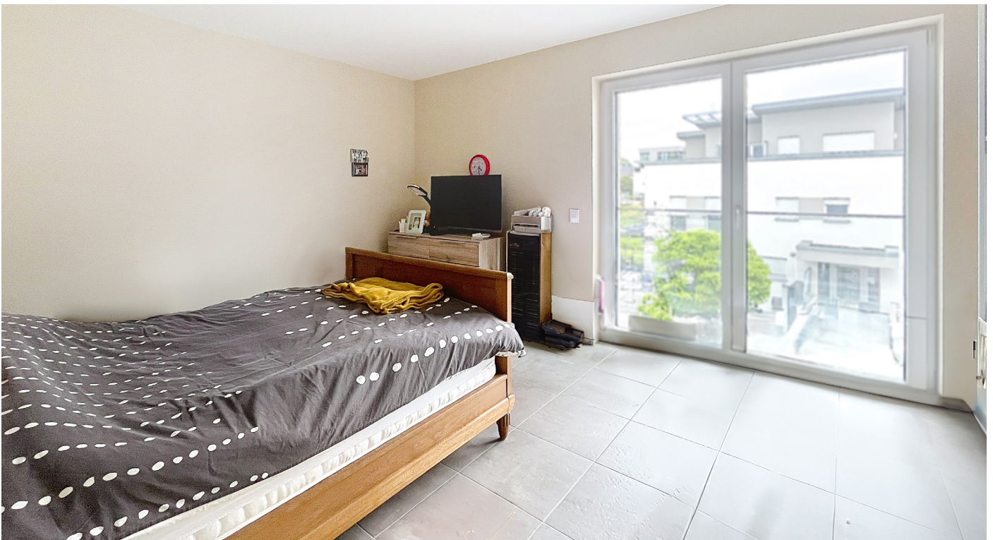
Innenfotos - Schlafzimmer