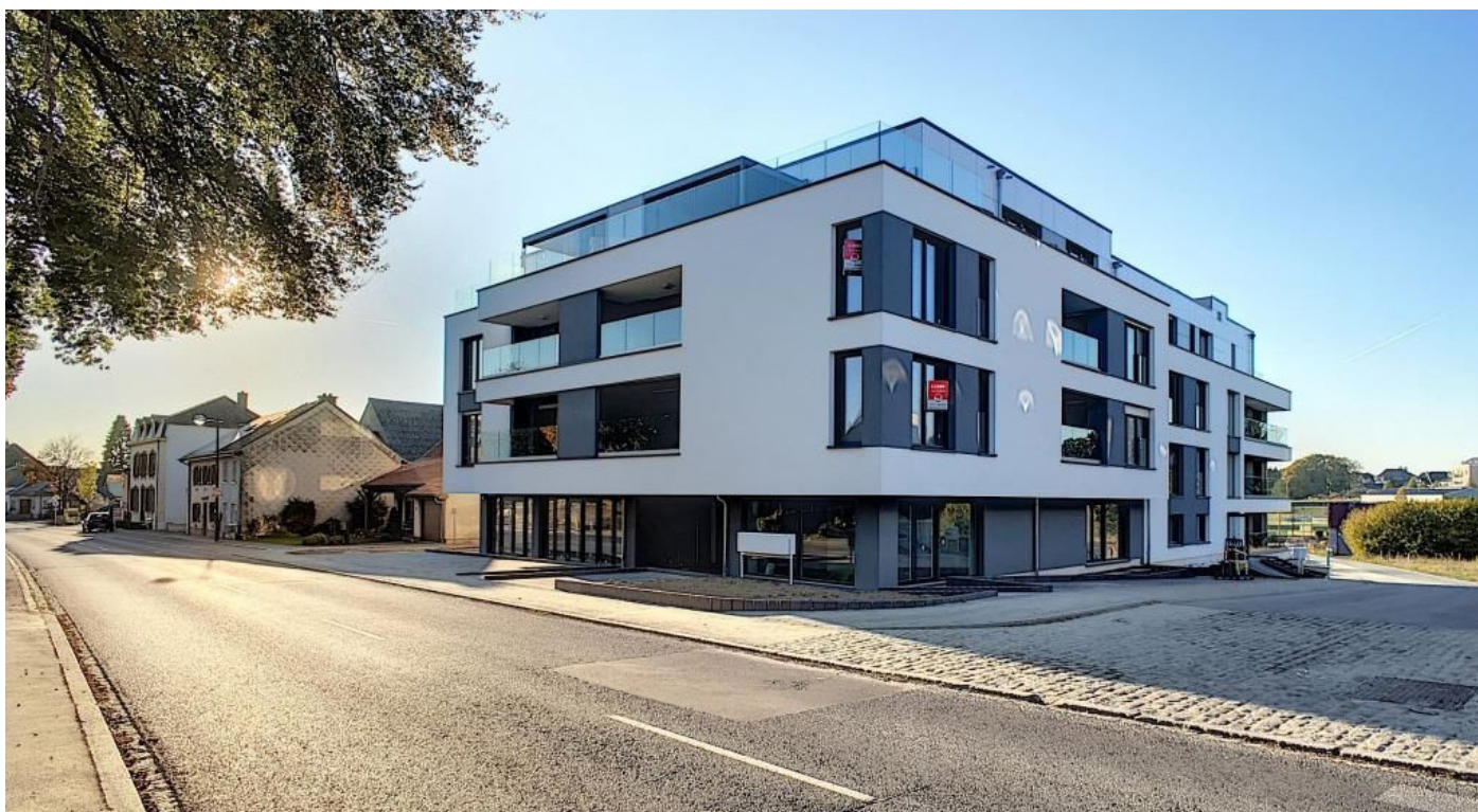
Außenfoto - Vorderansicht