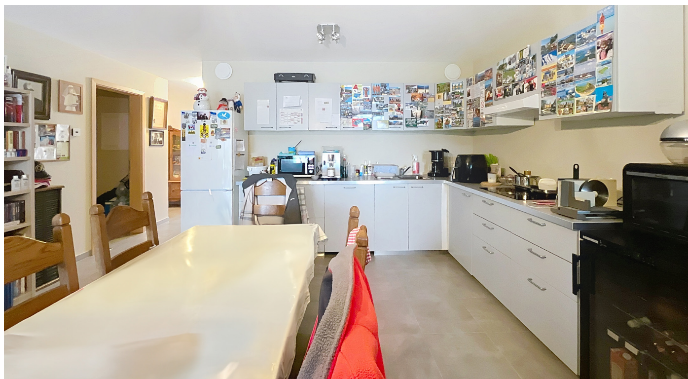
Innenfotos - Küche