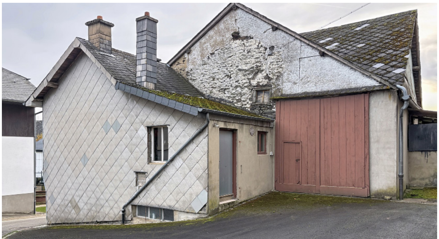
Außenfoto – Scheune