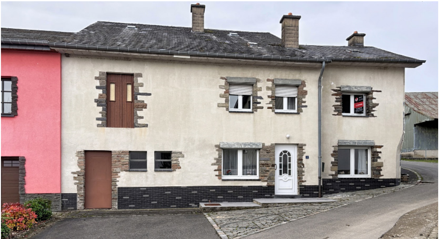
Außenfoto – Vorderansicht