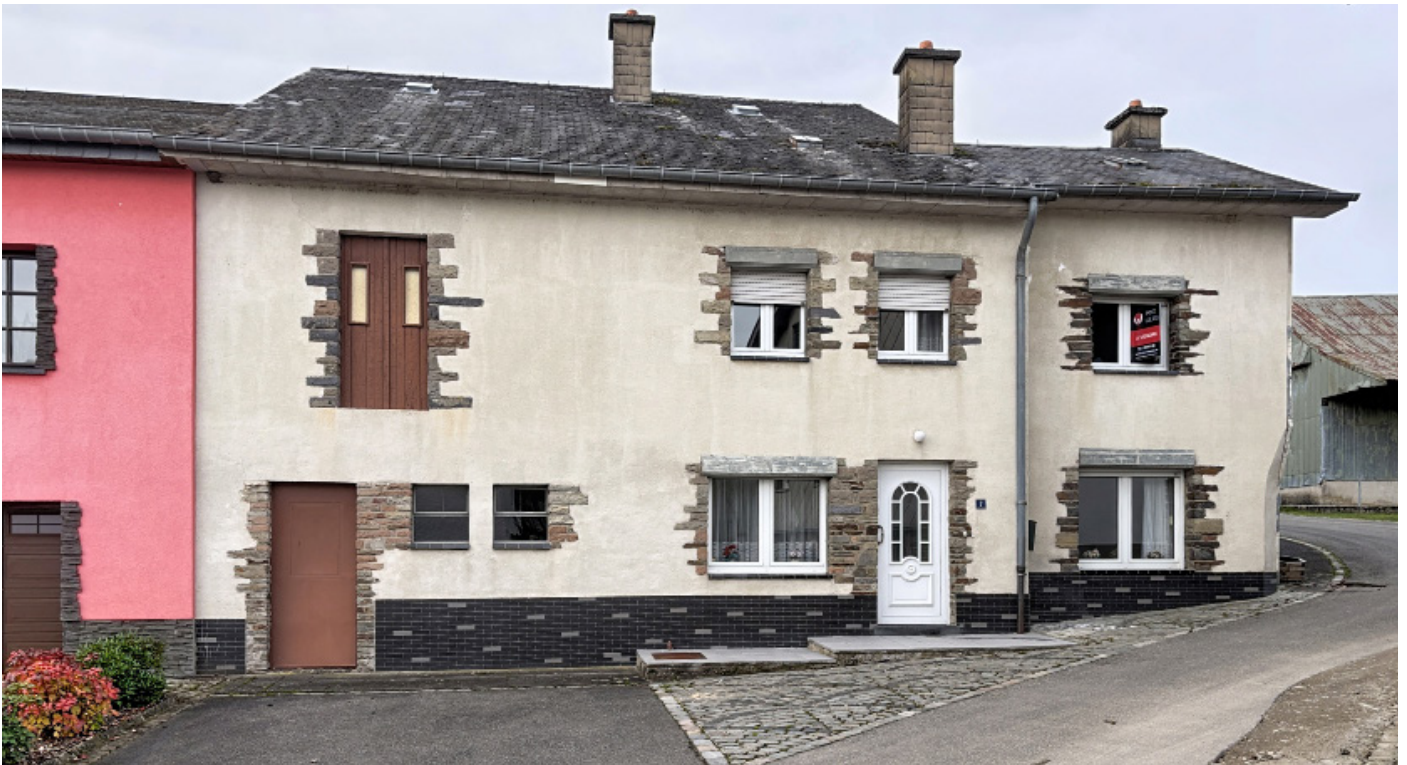
Photo extérieure -Vue extérieure