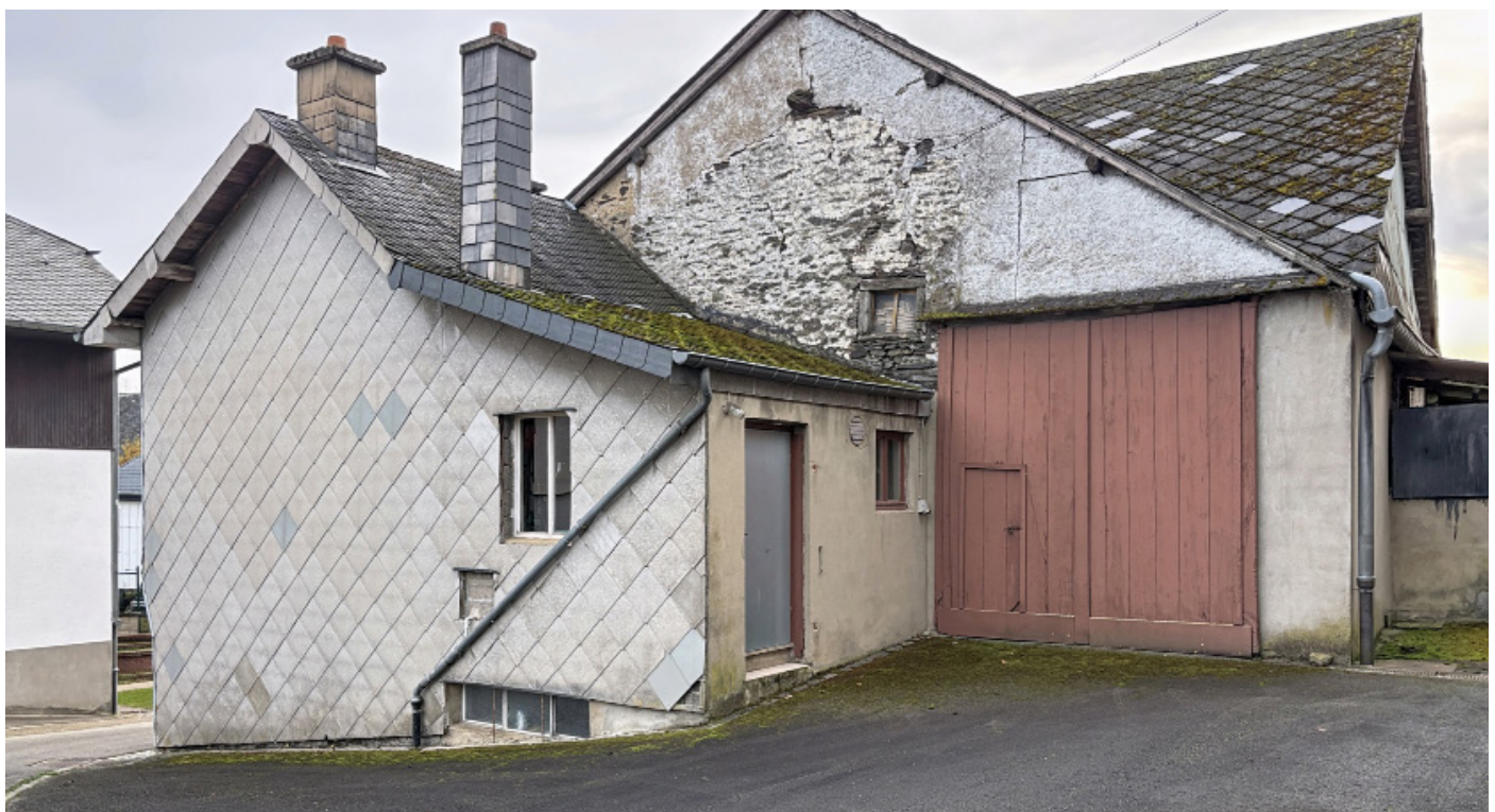
Photo extérieure - grange