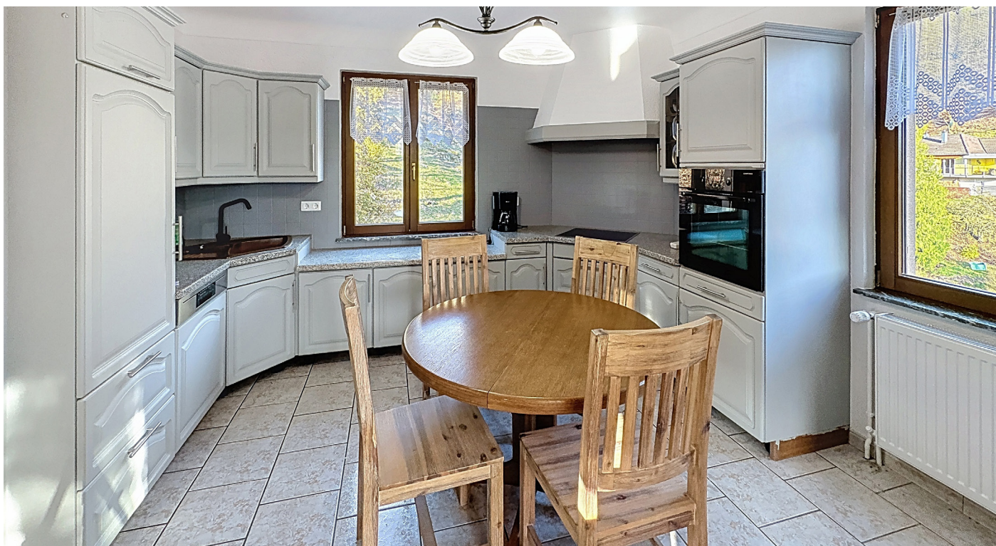
Photo intérieure - cuisine