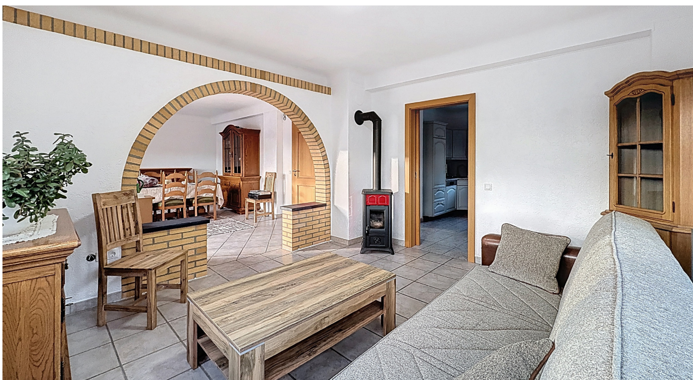
Photo intérieure - salon