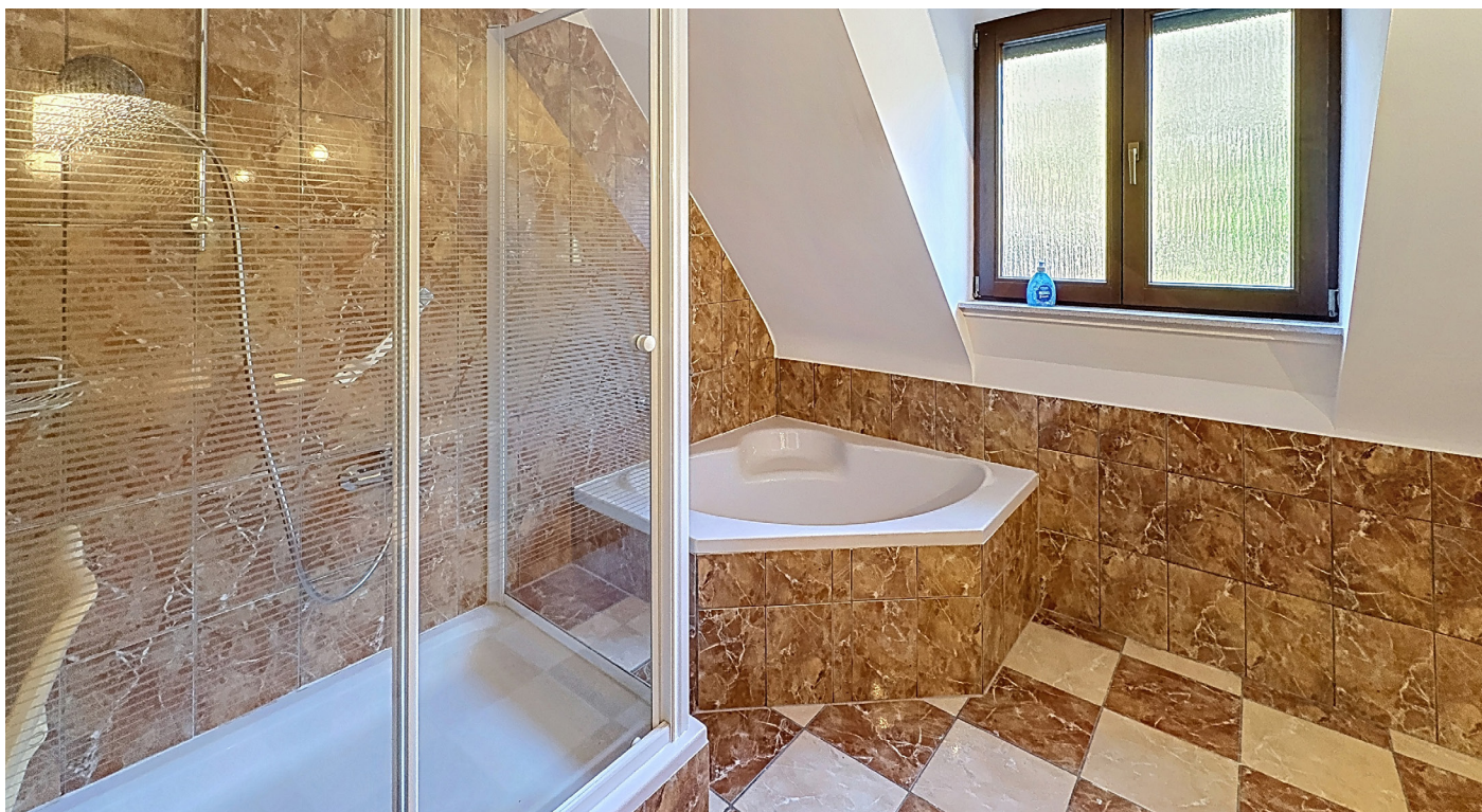
Photo intérieure - salle de bain