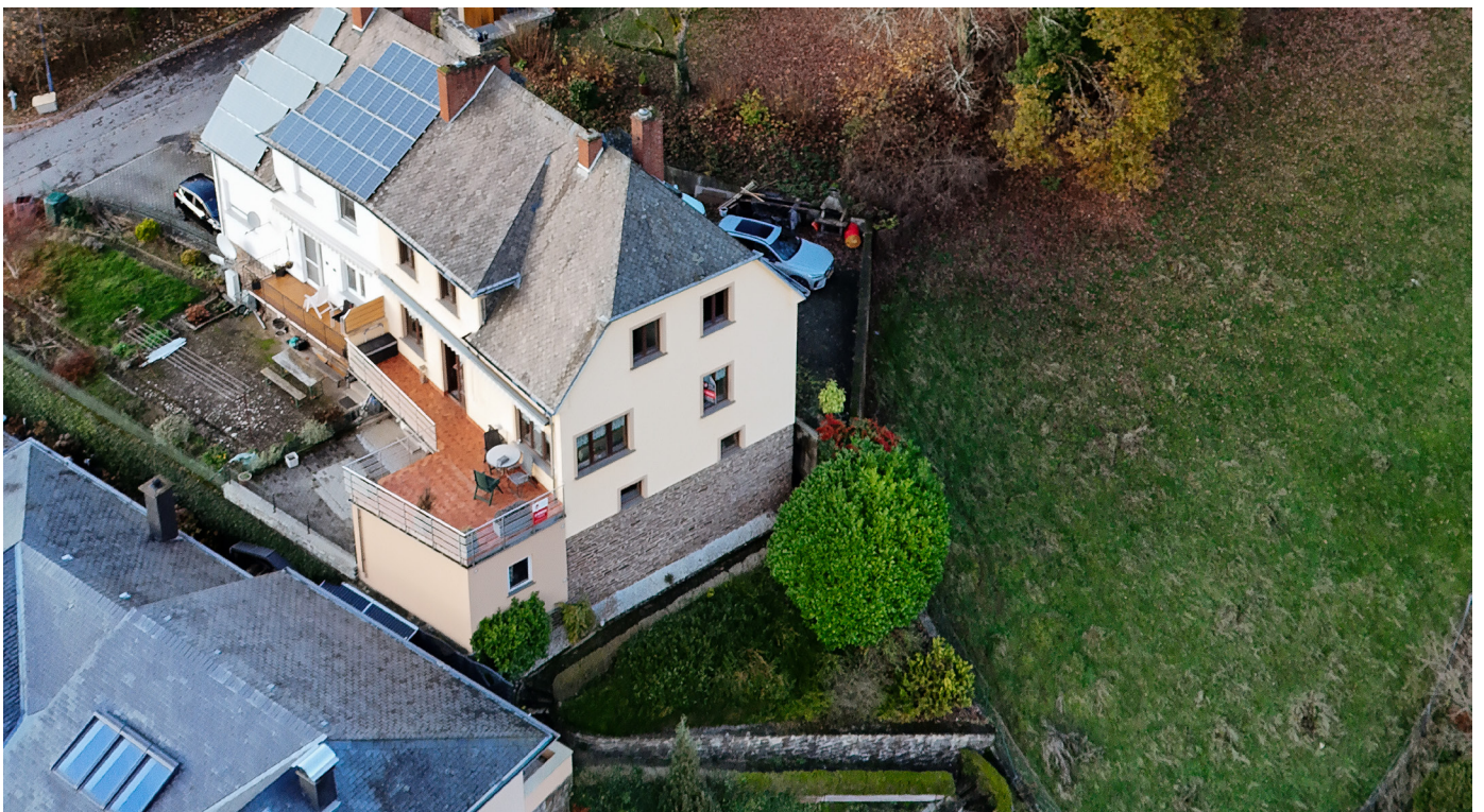
Photo extérieure - terrasse