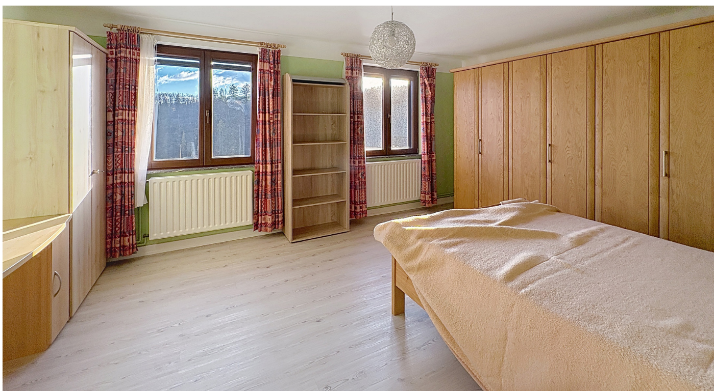
Photo intérieure - chambre 1