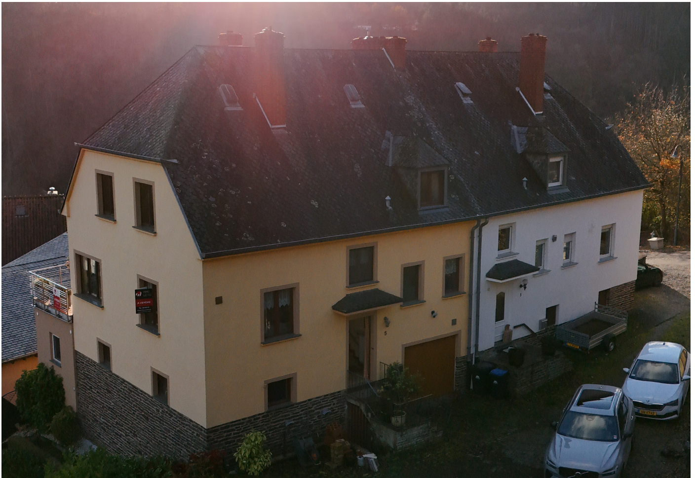
Photo extérieure - façade avant