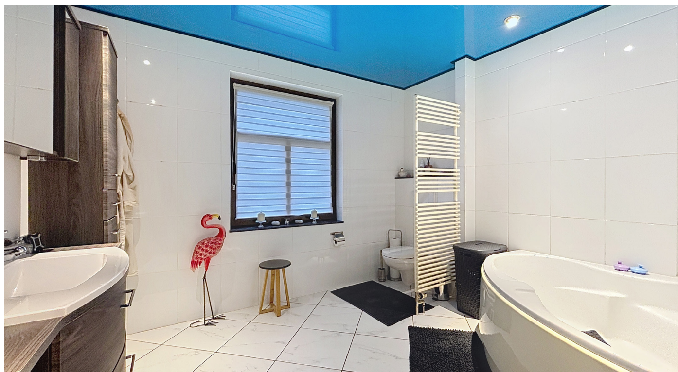
Photo intérieure - salle de bains