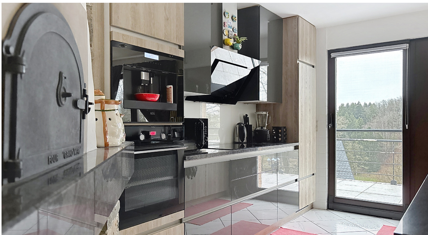
Photo intérieure - cuisine