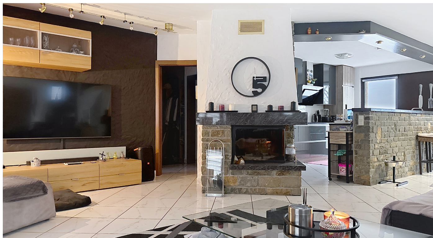
Photo intérieure - salon