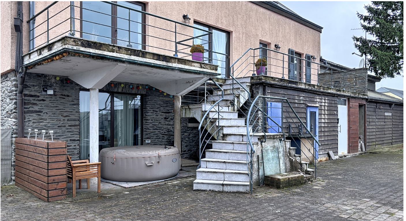
Photo extérieure -Vue extérieure