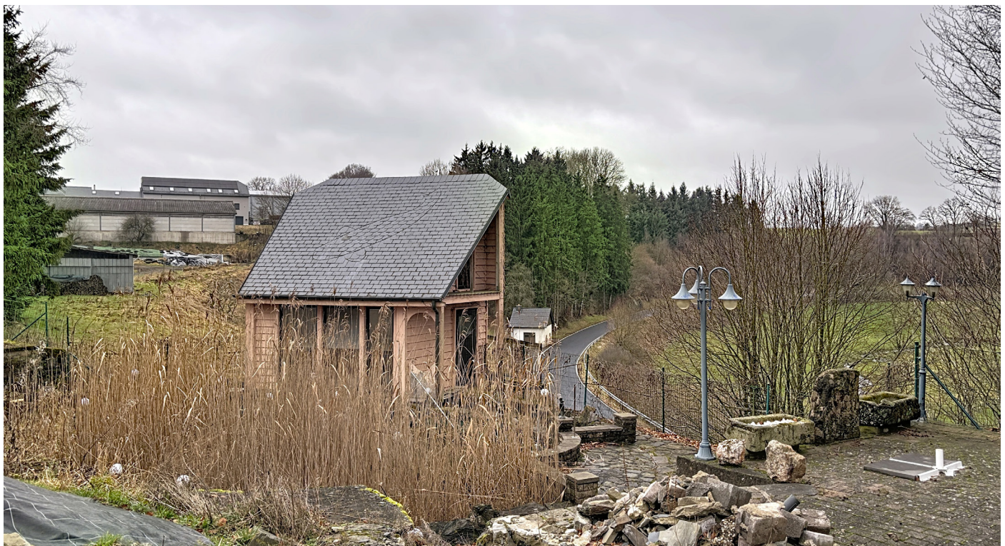
Photo extérieure - Jardin