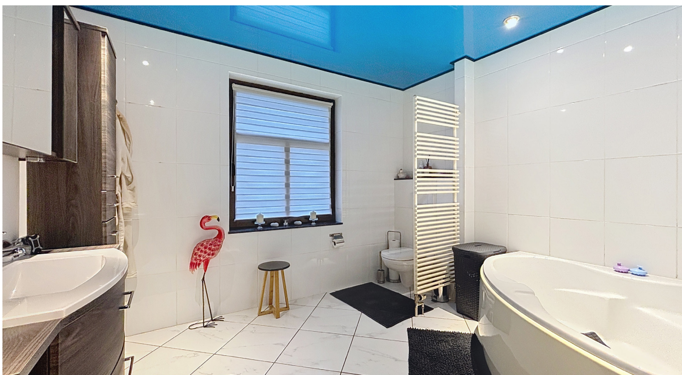
Innenfotos – Badezimmer