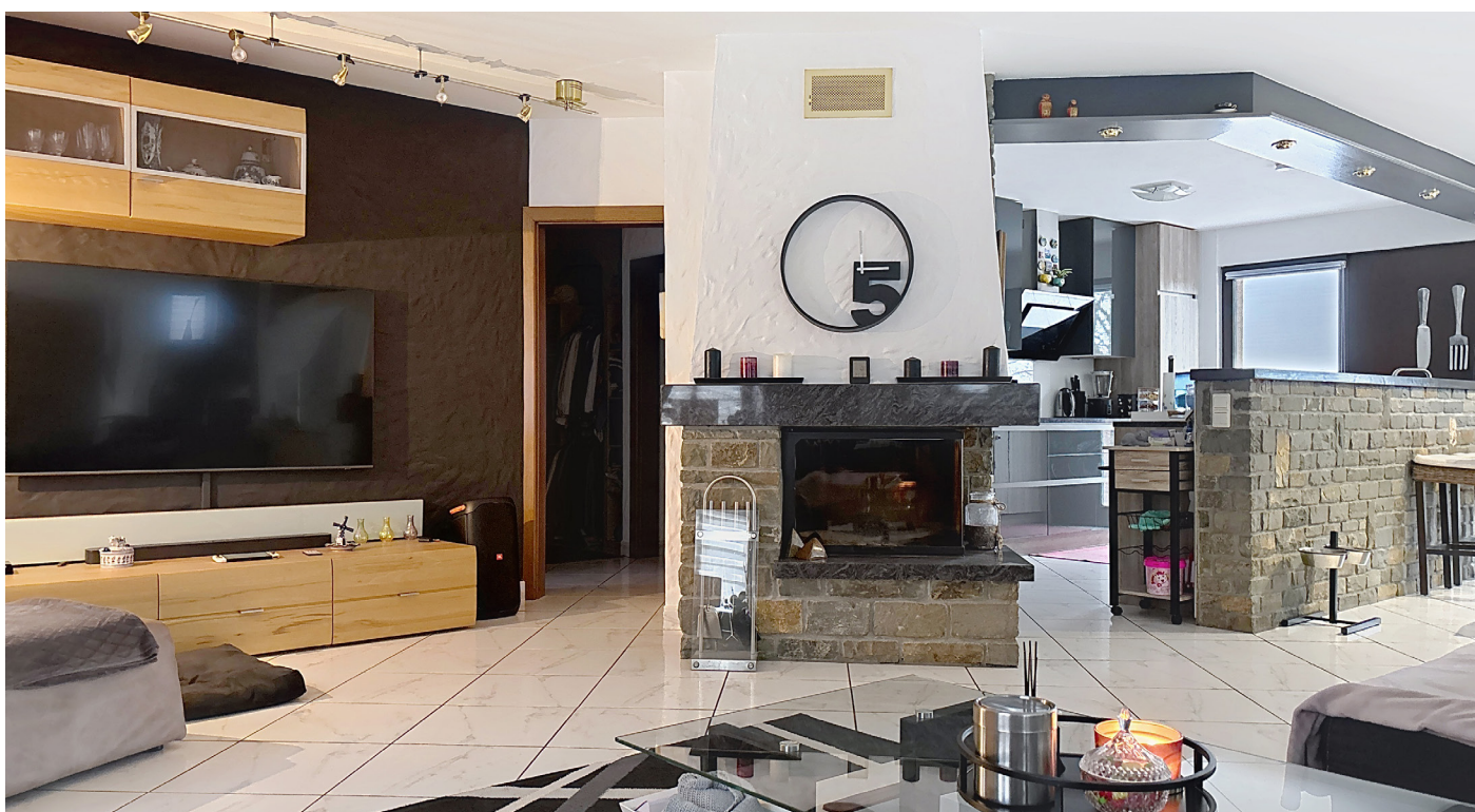
Innenfotos – Wohnzimmer