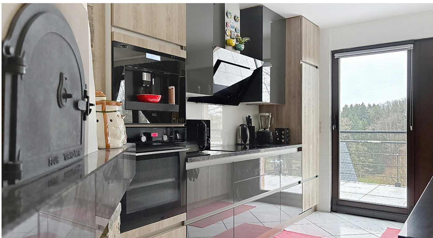
Innenfotos – Küche