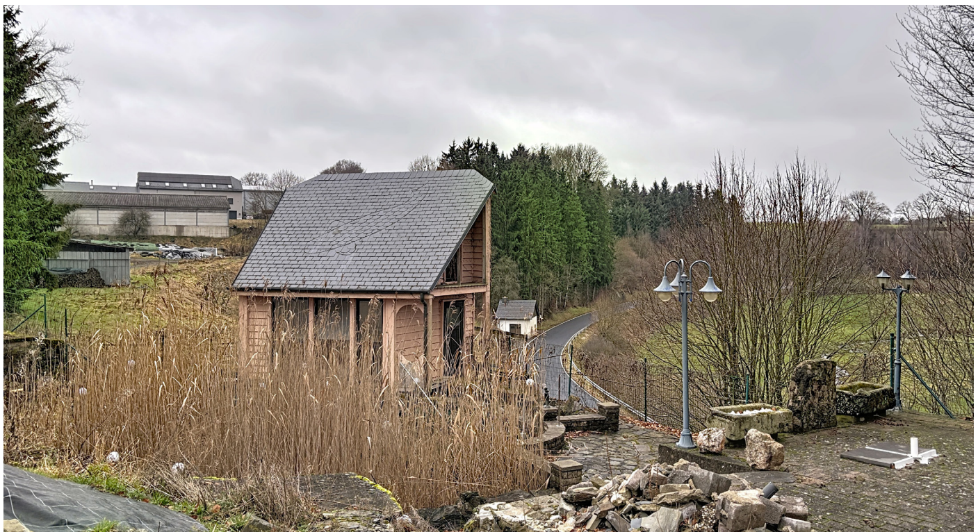
Außenfoto – Garten