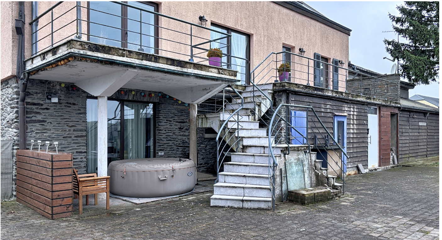
Außenfoto – Vorderansicht