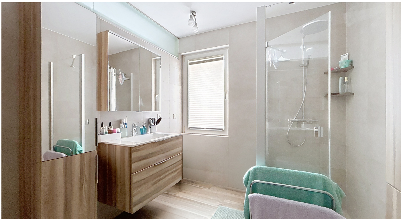
Photo intérieure - salle de douche