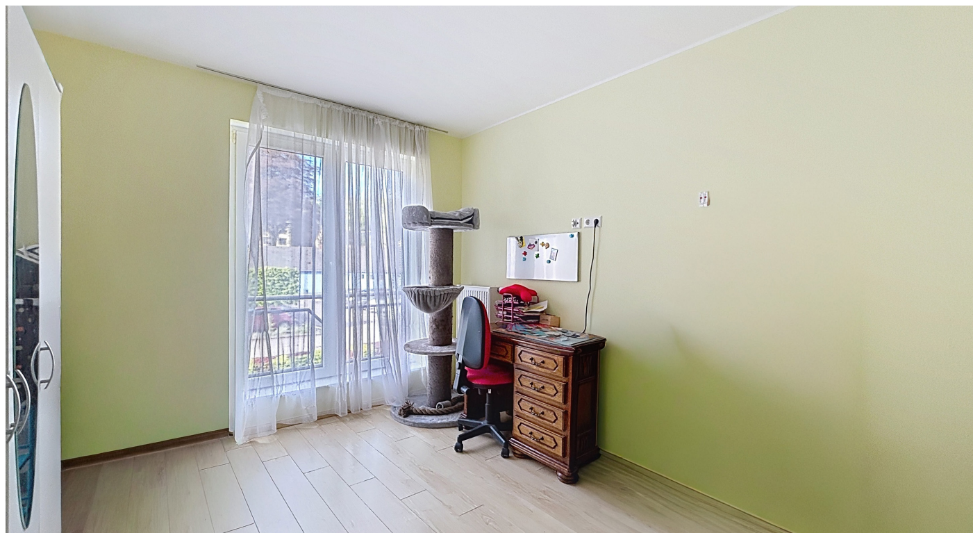
Photo intérieure - chambre 2