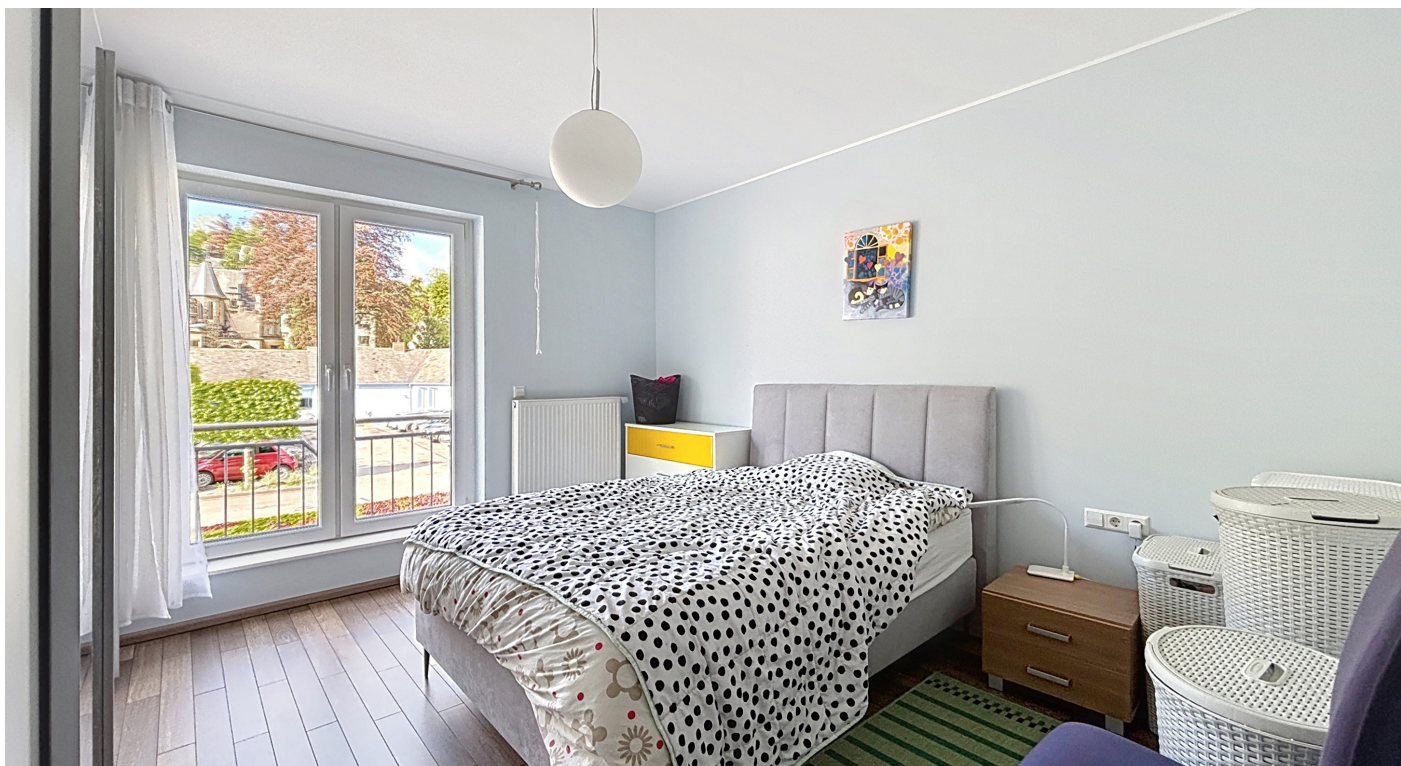
Photo intérieure - chambre 1