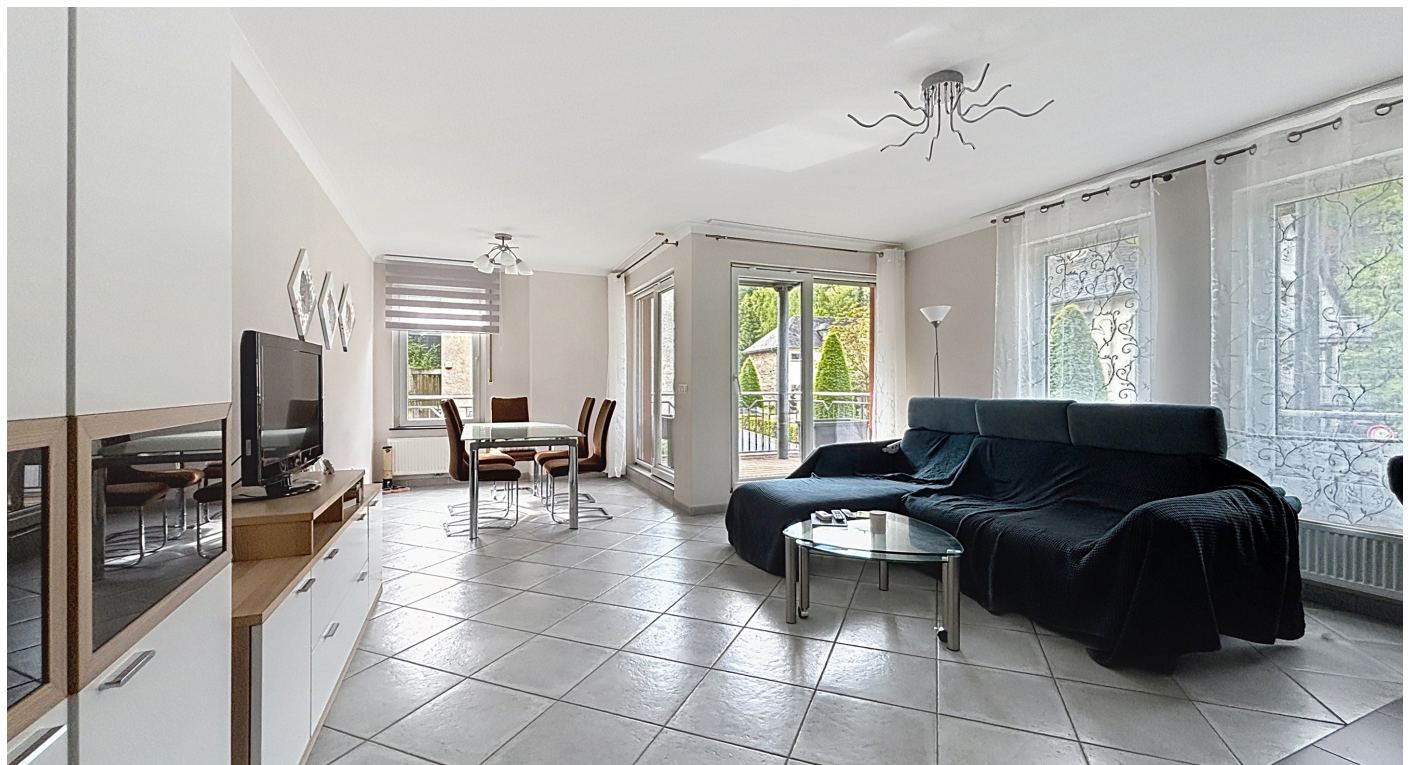
Photo intérieure - Salon