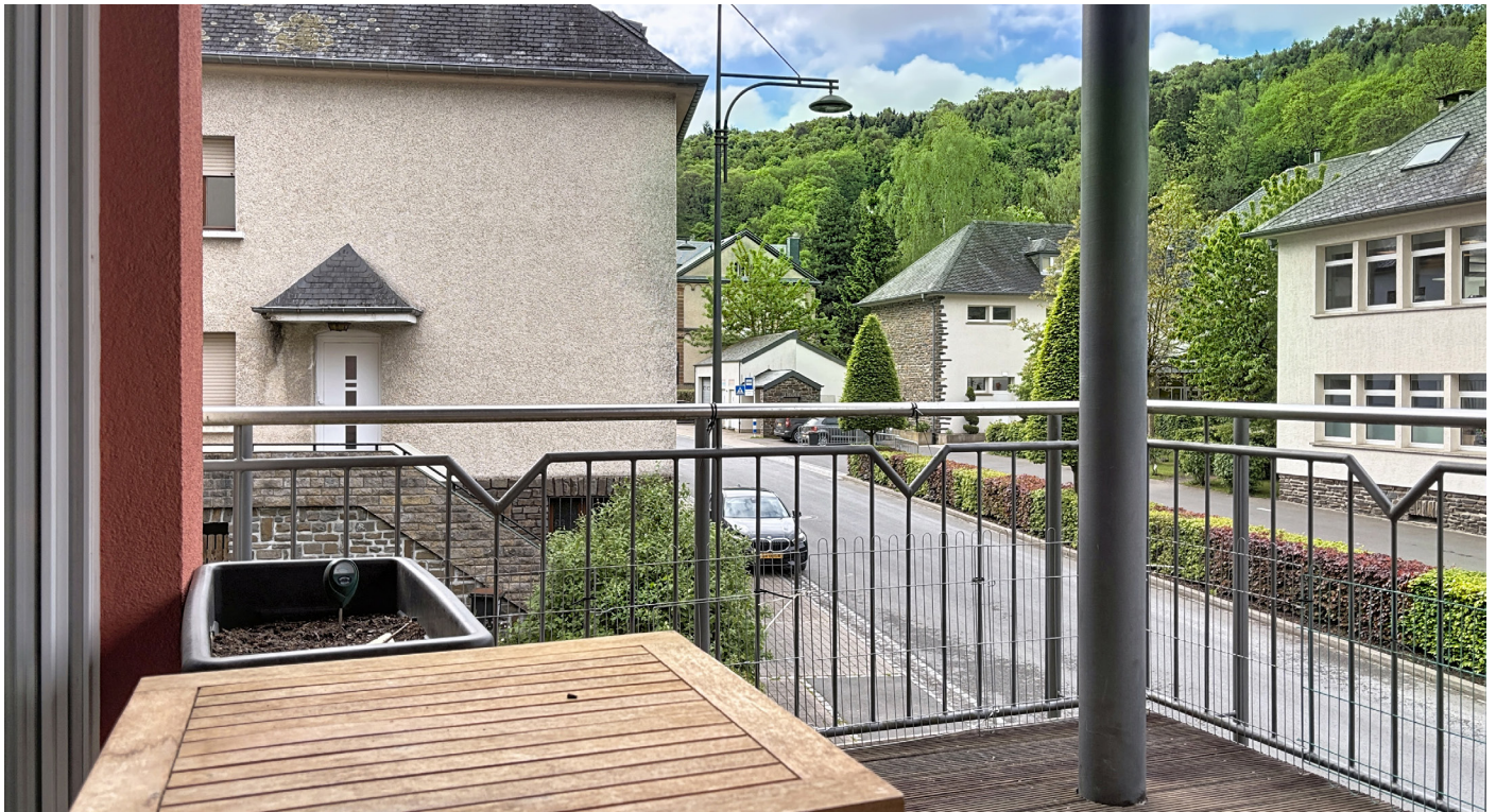
Photo extérieure - balcon