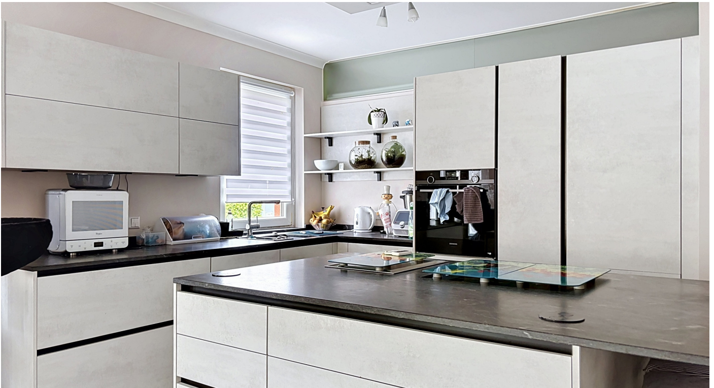
Photo intérieure - cuisine