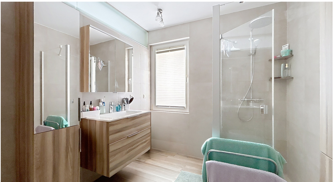
Innenfotos – Duschbad