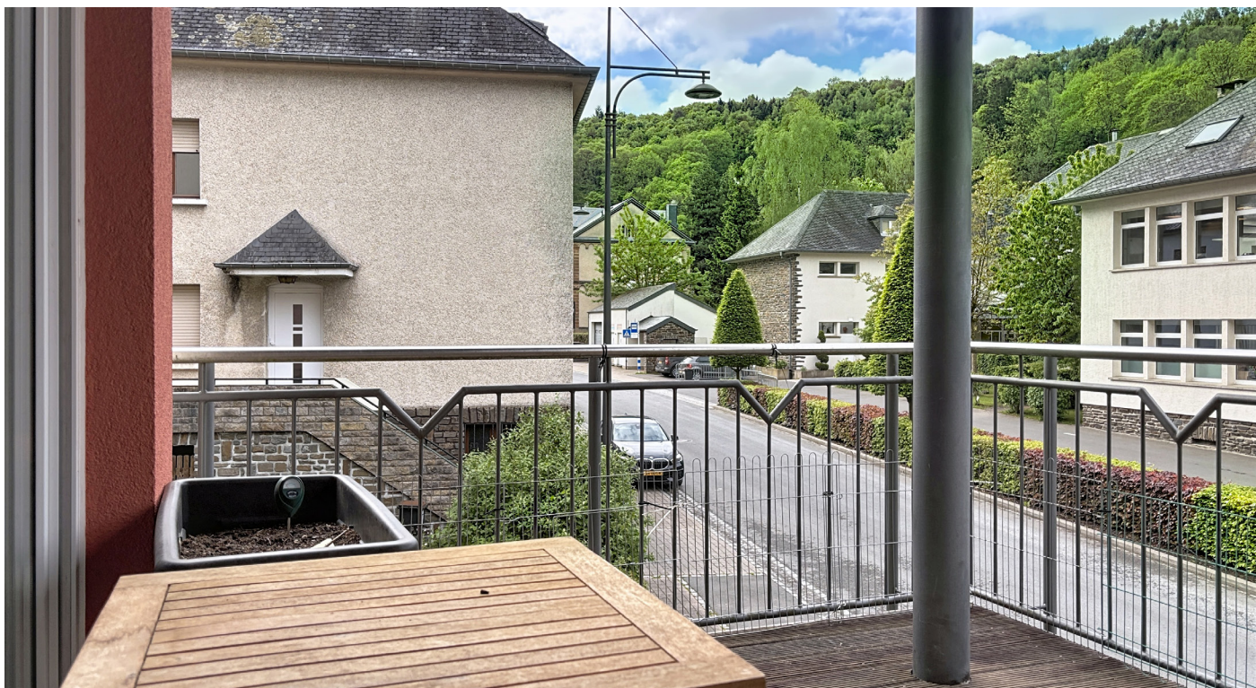
Außenfoto - Balkon