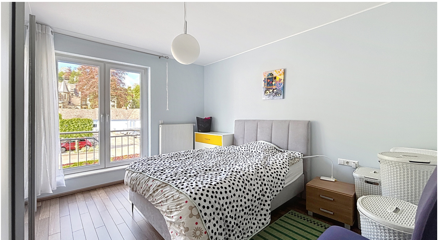
Innenfotos – Schlafzimmer 1