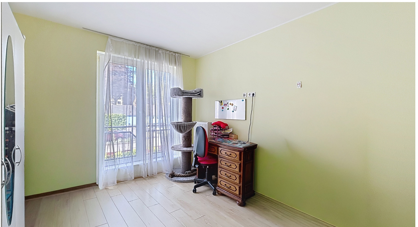
Innenfotos – Schlafzimmer 2