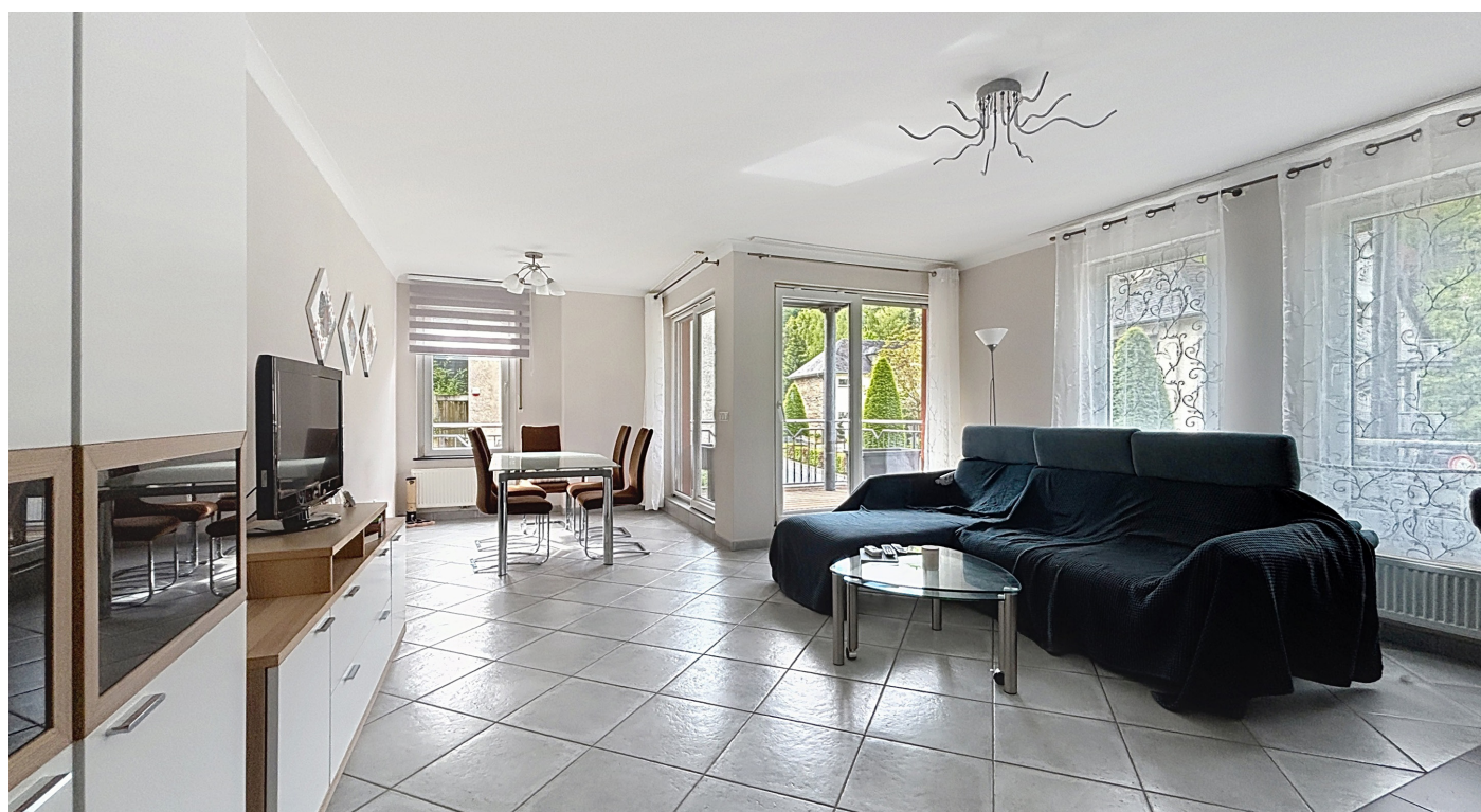
Innenfoto - Wohnzimmer