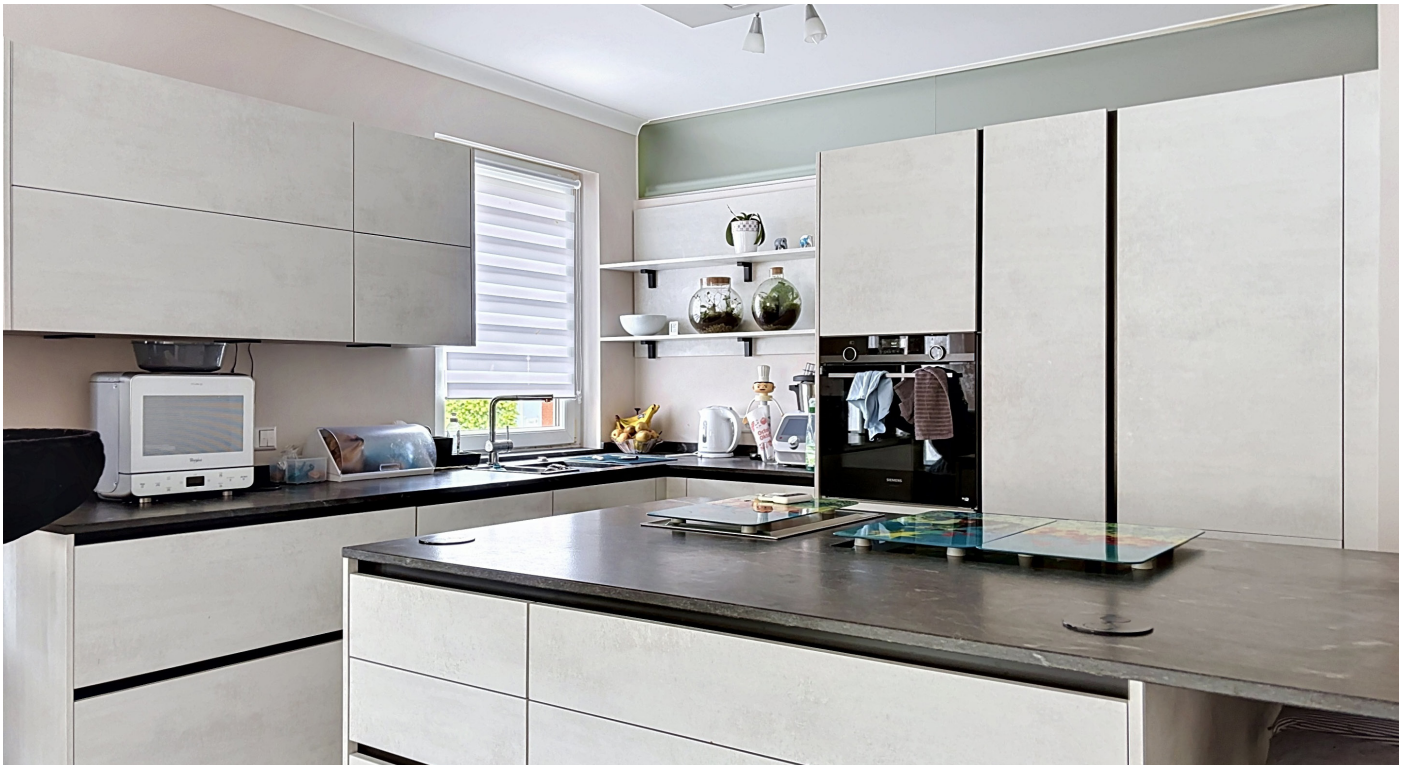
Innenfotos – Küche